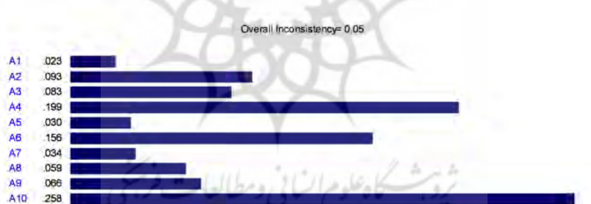
شکل شماره (۳). خروجی نرم‌افزار Expert Choice و نتایج و وزن‌های نهایی عوامل

به این ترتیب، عامل «رقابت هژمونیک میان ایران و عربستان برای رهبری و هدایت امور منطقه» به‌عنوان مهم‌ترین عامل تأثیرگذار بر واگرایی در روابط ایران و کشورهای حوزه خلیج فارس شناسایی شد و رتبه و وزن سایر عوامل، مطابق جدول شماره (۴) است.