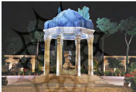
شکل ۳- محور حافظیه در شب

حافظیه نیز به مانند مجموعه زندیه یکی از اصلی ترین جاذبه‌های گردشگری شیراز هست و نکته بسیار مهم آن، بازدید این مجموعه تا حدود ساعت ۹ و ۱۰ شب هست. با این اساس می‌توان با توجه به جاذبه‌های دیگری که در اطراف این بنا وجود دارد گردشگران زیادی را در ساعات شب درگیر و ماندگار نمود. از جمله این بناها باغ جهان نما، حرم مطهر علی بن حمزه (ع) و کافه های خیابان جهان نما هست. البته جاذبه‌های دیگری چون دروازه قرآن، باغ هفت تنان، آرامگاه شاه شجاع، باغ چهل تنان، خواجوی کرمانی و .. را نیز می‌توان در مسیر گردشگری عنوان کرد. اما مشکل برخی از این جاذبه‌ها عدم نورپردازی مناسب هست که می‌توان به باغ هفت تنان و آرامگاه شاه شجاع اشاره کرد.