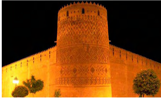
شکل ۲- محور زندیه در شب