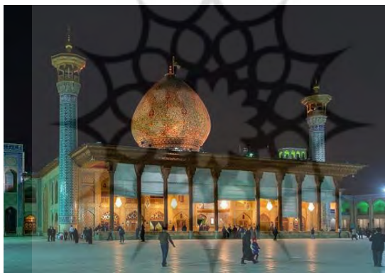
شکل ۴- حرم مطهر شاهچراغ(ع) در شب

حرم مطهر شاهچراغ(ع) یکی از مهم‌ترین جاذبه‌های مذهبی نه‌تنها شیراز بلکه ایران است و نقش مهمی در جذب گردشگران مختلف از نقاط مختلف ایران دارد. نکته مهم در خصوص این جاذبه این است که به‌صورت شبانه روزی به روی گردشگران باز هست به همین دلیل می‌توان از این ویژگی برای گردشگری شبانه بهره جست و با فراهم سازی بسیاری از امکانات گردشگری در شب به ماندگاری بیشتر گردشگران کمک نمود. می‌توان گردشگران در بازدید شبانه از حرم، به بناها و جاذبه‌های اطراف آن نیز آشنا و معرفی نمود. شاید یکی از مهم‌ترین ویژگی‌های این قسمت وجود حرم مطهر سید میرمحمد(ع)، مسجد عتیق و مسجد نو باشد که می‌توان در این زمینه بسیار حائز اهمیت باشد. البته وجود حرم سید علاءالدین حسین(ع) نیز که در محله بالاکفت قرار دارد می‌تواند نقش بسیار مهمی در این زمینه داشته باشد.