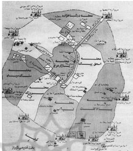
شکل ۱- نقشه بافت تاریخی شیراز

بخشی از محدوده مرکزی شهر شیراز را شامل می‌شود که امروزه منطقه ۸ شهرداری شیراز را تشکیل داده و خود دارای شهرداری مستقل هست. این منطقه علاوه بر این که هسته اولیه پیدایش شهر شیراز بوده، در حال حاضر نیز بسیاری از فعالیت‌های مرکزی تجاری، مذهبی، خدماتی و اداری را در خود جای داده و ظرفیت‌های بالفعل و بالقوه قابل توجهی جهت رونق فعالیت‌های سیاحتی، زیارتی، تجاری، فرهنگی و مسکونی دارد (وارثی و دیگران، ۱۳۹۱: ۱۳۳). بافت تاریخی شیراز تا زمان قاجار دارای محلات مختلفی بوده و کلانترهایی این محله‌ها را اداره می‌کردند. فارسنامه ناصری تألیف میرزا حسن فسایی حسینی این محلات را به‌طور مفصل توضیح داده است. او در این کتاب از محلات درب شاهزاده، سنگ سیاه، لب آب، بالاگفت، اسحق بیگ، سر باغ، سردزک، درب مسجد، میدان شاه، بازار مرغ، صحبت کرده و تعداد جمعیت، بناها و علمای این محلات را شناسایی و توضیح داده است. این بافت بارزش دارای جاذبه‌های بسیار مهمی از اوایل اسلام تا دوران قاجار است و نقش مهمی در جذب گردشگران دارد.