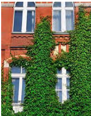
تصویر ۲- نمای سبز مستقیم (رخشان ده رو، ۲۰۱۶)

گیاهان خودرو که در پای ساختمان کاشته می‌شوند تا به صورت مستقیم به دیوارها و نما بچسبند و آن‌ها را کامل بپوشانند. در معماری سنتی از آن استفاده می‌شده است. روندهایی در پایه ساختمان همانند معماری سنتی در زمین کاشته شده، اجازه می‌دهند تا یک کار با فضای سبز ارزان را به دست آورید. گیاهان خود چسبنده که به‌طور مکرر مورد استفاده قرار می‌گیرند، دارای ساختار ریشه مکنده و حالت چسبنده هستند که به آن‌ها امکان اتصال مستقیم به یک دیوار را می‌دهد و تمام ارتفاع را می‌پوشاند؛ اما نمی‌توان از آن‌ها برای کلیه نمای ساختمان‌ها استفاده کرد. این گیاهان رونده ته‌جمی می‌توانند دیواره‌های نامناسب را پوشیده کرده و برخی از مشکلات را برای نگهداری و یا زمان رسیدن برداشتن گیاه ایجاد کنند می‌تواند باعث ایجاد پوسیدگی‌های نامناسب در دیوار شود. (پرینی و روساسکو ۲۰۱۳) (تصویر ۲)