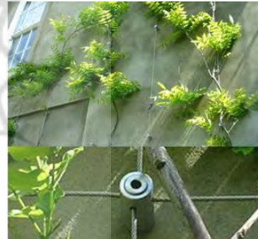
تصویر ۴- سیم‌های ضدزنگ استیل (رخشان ده رو، ۲۰۱۶)