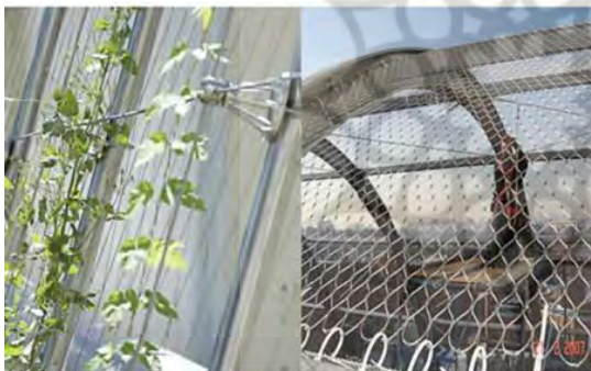
تصویر ۵- کابل و طناب سیمی توری (رخشان ده رو، ۲۰۱۶)

ب- سیستم کابل یا طناب سیمی توری: خواستار نوعی کابل‌های بسیار کشسان و انعطاف‌پذیر است که بتواند به بیشمار طرح و اندازه تبدیل شوند. سیستم طناب فلزی برای موارد زیر استفاده می‌شود: گیاهانی با سرعت رشد آرام و فراهم کردن درجه‌ای بهتر از سودمندی طراحی سیستم کابل برای موارد روبه‌رو کاربرد دارد: گیاهانی با سرعت رشد سریع و شاخ و برگ‌های انبوه (اوتله و همکاران، ۲۰۱۱) (تصویر ۴، تصویر ۵)