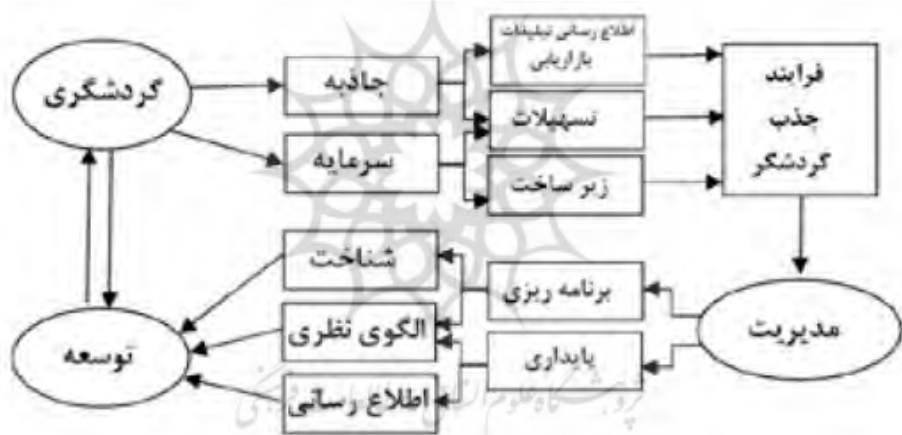
شکل شماره (۱). اجزای یک نظام گردشگری در نگرشی پساساختاری (پاپلی یزدی و سقایی، ۱۳۸۵: ۱۲۴)

سرمایه‌گذاری جهانی نیز در صنعت گردشگری به کار گرفته شده است. ۱۱ درصد از مالیات جهان هم از این صنعت حاصل می‌شود (طالع ماسوله، ۱۳۸۸: ۲۳). برنامه‌ریزی گردشگری را به‌طور تنگاتنگی با برنامه‌ریزی توسعه مرتبط می‌دانند و آن را مستلزم لحاظ کردن عواملی نظیر اقتصاد، نیاز گردشگران و ملاحظات مربوط به سکنه بومی تلقی می‌کنند. در چارچوب برنامه‌ریزی گردشگری باید تمام فرایندها و روندهای حاکم و مؤثر بر آن به طور همه‌جانبه مورد بررسی و تحلیل قرار گیرد. بر این اساس، قبل از هرگونه برنامه‌ریزی، نخست باید اجزای موضوع مورد برنامه‌ریزی را شناسایی و تحلیل کرد (نوری کرمانی و همکاران، ۱۳۸۸: ۵-۴). شکل شماره (۱) اجزای فرایند گردشگری را به صورت ساده نشان می‌دهد: