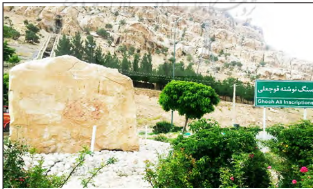
شکل شماره (۸). مؤلفه‌های مصنوع هویت‌بخش؛ سنگ‌نوشته قوچعلی

بر دیواره صخره‌ای در تنگه قوچعلی (محل سبزی‌آباد) سنگ‌نوشته‌ای به خط نستعلیق به اندازه ۵۰ در ۷۰ سانتی‌متر وجود دارد. مضمون این سنگ‌نوشته، تاریخ به خاکسپاری حسینقلی خان و اشاره به ساخت قلعه‌های حسین‌آباد و حسینیه و نهر امیرآباد به فرمان حسینقلی خان امیر تومان، والی لرستان، در سال ۱۳۰۵ق. است.