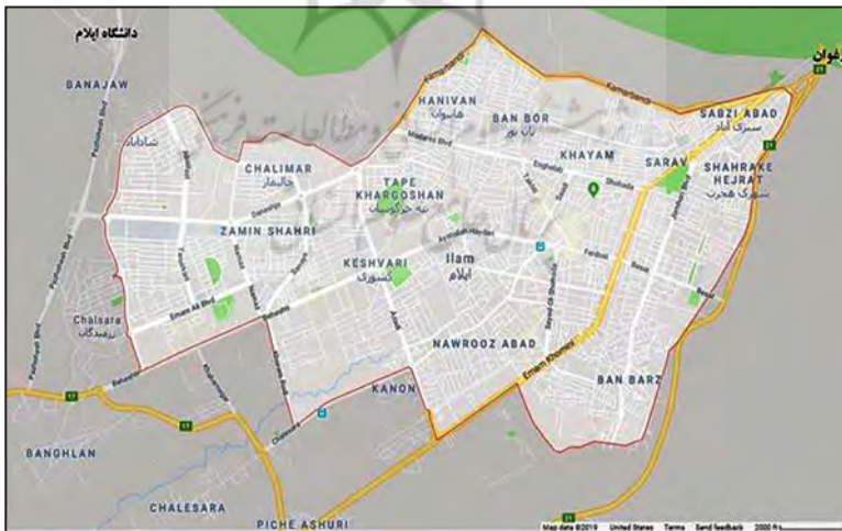
شکل شماره (۲). نقشه شهر ایلام

این مطالعه از لحاظ نوع، توصیفی - تحلیلی است و در پارادایم کیفی و با استفاده از تکنیک‌های مشاهده و مطالعات اسنادی انجام گرفته؛ یعنی جهت تکمیل اطلاعات آن از اسناد کتابخانه‌ای و مشاهده میدانی استفاده شده است. پس از تدوین چارچوب نظری آن، برای تجزیه و تحلیل و شناخت هویت شهر ایلام ۳ مؤلفه در نظر گرفته شد که هر کدام زیرمؤلفه‌هایی دارند که هویت شهر ایلام متناسب با آنها شناسایی و بررسی شده است. شکل شماره ۲، نقشه شهر ایلام را نشان می‌دهد.