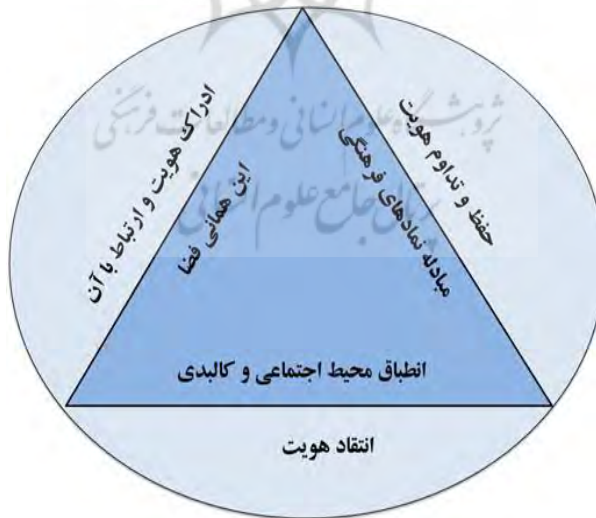
شکل شماره (۱). هویت شهر (مظفری و قربانزاده، ۱۳۹۲: ۸۴)

یکی از نیازهای اجتماع انسانی، احساس امنیت و تعلق است. در این راستا هویت و عناصر هویتی در زندگی انسان موجب آرامش، اعتماد به نفس، تلاش مستمر و احساس امنیت می شود. بحران در هویت شهرهایمان از زمانی آغاز می گردد که در تحول و گذار از شهر سنتی به کلانشهر مدرن، پدیده شهر و زندگی شهری، تابع دو زمینه مشروط کننده اجتماعی (رشد و تحرک اجتماعی) و اقتصادی (شرایط اشتغال شهروندان) می گردد. عواملی که پایه نظام یابی فضایی کالبدی شهر و هویت آن می شوند با مشارکت نابرابر مردم در فعالیتهای اقتصادی، اجتماعی و سیاسی شهر، فرهنگی را بنا می نهند که بنیانی طبقاتی - شغلی دارد؛ بنابراین مبنا و عوامل اصلی تفاوت کیفی عملکرد شهرها و هویت آنها نیز در شرایطی که دو زمینه فوق در عدم یگانگی شهروندان با شهر ایجاد کرده اند قابل جستجو بوده است (مظفری و قربانزاده، ۱۳۹۲: ۸۴).