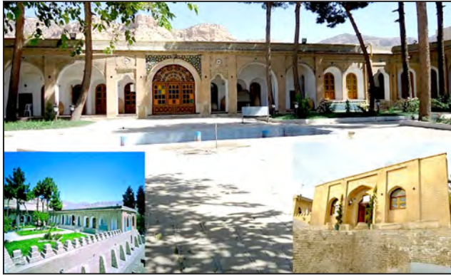
شکل شماره (۶). مؤلفه‌های مصنوع هویت بخش؛ قلعه والی ایلام

کاخ فلاحتی واقع در خیابان آیت‌الله حیدری در محله شادآباد (از محلات قدیمی شهر ایلام)، به دستور والی غلامرضاخان در دوره قاجار در سال ۱۳۲۶ ه.ق. احداث گردیده است. مساحت این کاخ ۸۱۰ متر مربع و زیربنای آن در حدود ۳۳۷ متر مربع است. نقشه درون کاخ به صورت دو اتاق تودرتو در اطراف و یک هال بزرگ در وسط می‌باشد. در جلوی هال نیز یک ایوان قرار گرفته که در اتاق‌ها و هال رو به آن باز می‌شوند. دو طرف اتاق‌ها به صورت چند ضلعی منظم بیرون آمده و بین آنها دو تراس قرار دارد. در هر دو طرف، پنجره‌های به ابعاد ۱ در ۲ متر تعبیه شده که با طاقی نیم‌دایره‌ای و گچبری‌هایی زیبا با نقوش انسان و گل و گیاه مزین شده است. سقف تراس بر دو ستون قرار گرفته است و سرستون‌ها به شیوه کوفی ساخته شده‌اند؛ ولی داخل اتاق‌ها بسیار ساده و بدون تزیین است. سقف کاخ نیز به صورت طاق ضربی با تیرهای چوبی و ملات‌اندود است که سطحی شیب‌دار دارد و با ورق گالوانیزه پوشانده شده است. در ساخت این بنا از مصالحی نظیر آجرهای مربع شکل، سنگ‌های تراش‌خورده، چوب، گچ و ورق گالوانیزه برای پشت بام استفاده شده و کف کاخ نیز با آجر، فرش گردیده است. کف پیاده‌رو و صحن آن چنانکه مشخص است آجر فرش بوده و به علت استفاده بی‌رویه، سطح آن خراب شده و در بازسازی آن از موزاییک استفاده گردیده است.