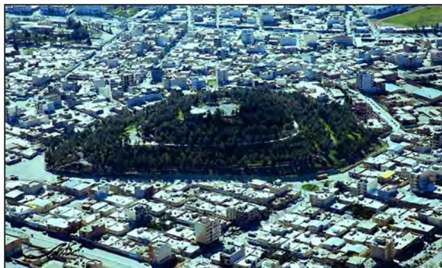
شکل شماره (۳). تپه خرگوشان به عنوان یکی از مهمترین مؤلفه‌های طبیعی هویت شهری ایلام

مؤلفه‌های انسانی هویت‌بخش شهر ایلام شامل متغیرهایی چون: زبان، رفتارهای اجتماعی، اعتقادات، آداب و رسوم، سیره و سبک خاص زندگی ساکنان ایلام است.