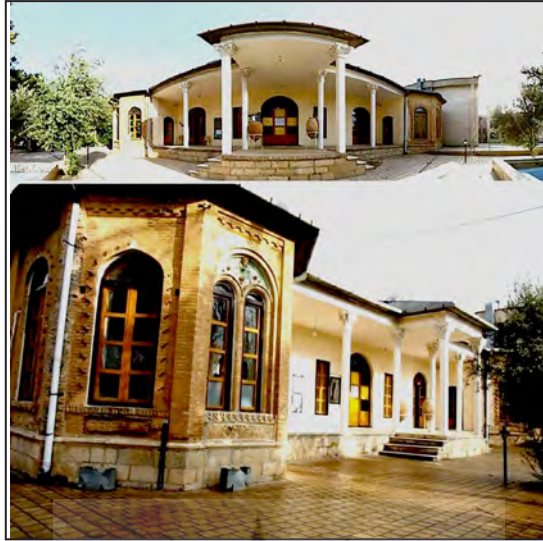
شکل شماره (۷). مؤلفه‌های مصنوع هویت‌بخش؛ کاخ فلاحتی ایلام

بر دیواره صخره‌ای در تنگه قوچعلی (محل سبزی‌آباد) سنگ‌نوشته‌ای به خط نستعلیق به اندازه ۵۰ در ۷۰ سانتی‌متر وجود دارد. مضمون این سنگ‌نوشته، تاریخ به خاکسپاری حسینقلی خان و اشاره به ساخت قلعه‌های حسین‌آباد و حسینیه و نهر امیرآباد به فرمان حسینقلی خان امیر تومان، والی لرستان، در سال ۱۳۰۵ق. است.