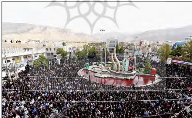
شکل شماره (۵). مؤلفه‌های انسانی هویت بخش (مؤلفه‌های مذهبی، مراسم عاشورای حسینی (ع))

مؤلفه‌های دینی مانند مراسم عزاداری محرم و برپایی هیئت‌ها و موکب‌ها با اینکه نمادی از هویت مذهبی شهر ایلام هستند؛ اما با توجه به اینکه مقطعی و فصلی بوده و دائمی نیستند، آن تأثیر بایسته را ندارند.