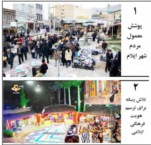
شکل شماره (۴). مؤلفه‌های انسانی هویت بخش (مؤلفه‌های فرهنگی: لباس، پوشش و آداب)

مؤلفه‌های دینی مانند مراسم عزاداری محرم و برپایی هیئت‌ها و موکب‌ها با اینکه نمادی از هویت مذهبی شهر ایلام هستند؛ اما با توجه به اینکه مقطعی و فصلی بوده و دائمی نیستند، آن تأثیر بایسته را ندارند.