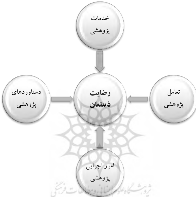
شکل ۲- مدل مفهومی تحقیق

پژوهش و هفته کتاب و هفته نیروی انتظامی، برگزاری میزگردها و اتاق‌های اندیشه ورزی و کرسی‌های علمی- ترویجی) مورد مطالعه می‌باشد.