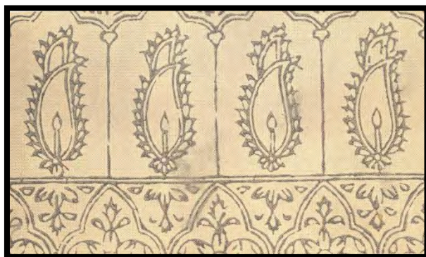
تصویر ۱. طرح یک پرده قلم کار

اسناد گوناگون نشان می‌دهند اوج شکوفایی این صنعت در دوره صفویان بوده است. در آن دوران انواع مختلف لباس‌های قلمکاری شکل گرفت که معروف‌ترین آنها قلمکاری زر یا اکلیل و جیگرناات قرمز و بنفش بود. همچنین از این پارچه‌ها برای لباس‌های درباریان استفاده می‌کردند که به آنها دلگه ۱ می‌گفتند.