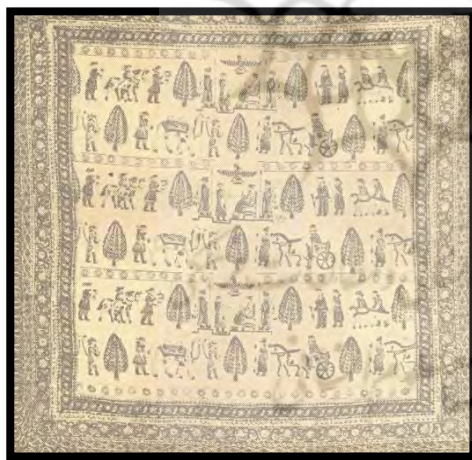
تصویر ۲. یک بقچه قلم‌کاری شده

به طور کلی پارچه قلم‌کار از نظر استاد ماهرزن به چند قسمت تقسیم می‌شود. کناره پارچه را حاشیه یا دور می‌نامند. پس از حاشیه، کتفه ۱ و پس از آن میونه یا میان قرار دارد. به این ترتیب هر قالب علاوه بر نقش، اسم محلی را که باید در آنجا به کار برود با خود همراه دارد؛ مثل قالب کلوزه‌ای حاشیه یا مجلس شاه عباس حاشیه، مجلس شاه عباس کتفه و غیره. البته ممکن است یک قالب هم برای حاشیه و هم برای کتفه و هم برای میان به کار رود. هر یک از نقش‌های قلم‌کار چند قالب دارد. برخی نقش‌های پارچه‌های قلم‌کار عبارت‌اند از: دو بوته‌ای (میان)، گلدان بزرگ (میان)، گلدان تازی (میان - حاشیه)، زنجیر اناری (حاشیه)، زنجیر خورشیدی (حاشیه)، ترنج ترمه‌ای، بته شویدی (میان)، گل کاشی (میان) کاج (میان)، چهار گل، انگوری، ۲۰ بته (میان)، دست گلی (میان)، درویشی، گلیمی و غیره. به طور کلی، تنوع نقش در پارچه‌های قلم‌کار یکی از عللی است که این بافته را مناسب ذوق و سلیقه خریداران کرده است؛ زیرا نقوش این گونه پارچه‌ها از طرح‌ها و اشکال متنوع و بسیاری تشکیل شده است و تا حدودی به نقشه‌های قالی‌های ایرانی شباهت دارد. در گذشته نقوش پارچه‌های قلم‌کار عبارت بودند از: