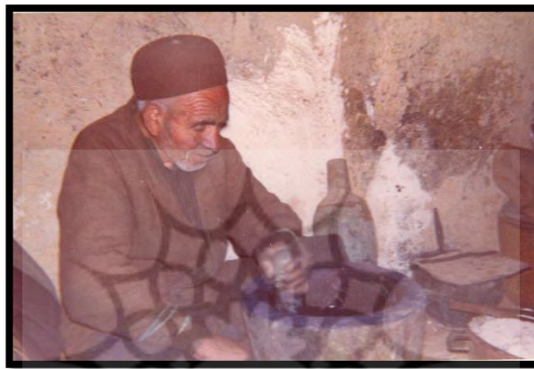
تصویر ۴. رنگ‌سابی

پوست تختی چهار زانو بنشیند و کار خود را انجام دهد. سمت راست کارگر قدحی قرار دارد که رنگ در آن ریخته شده و روی رنگ، لایه پوستی یا پارچه‌ای است که از انبوهی رنگ برای چسبیدن به مُهر جلوگیری می‌کند. قلم موی بزرگ رنگ‌آمیزی یا فرچه ریش‌تراشی هم وجود دارد که معمولاً کارگران کم سن و سال‌تر با آن‌ها آموزش چگونگی مُهر زدن می‌دیدند.