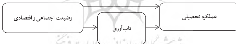
شکل ۱: مدل مفهومی پژوهش

پژوهش‌های زیادی به بررسی عوامل موثر بر عملکرد تحصیلی دانش‌آموزان پرداخته‌اند. ولی تاکنون در ایران تحقیقات اندکی به بررسی تأثیر چند سطحی داده‌ها بر عملکرد تحصیلی دانش‌آموزان پرداخته است. لذا بررسی سطوح مختلف (دانش‌آموز و خانواده) بر اساس وضعیت اقتصادی - اجتماعی و تأثیر هر یک از سطوح بر عملکرد تحصیلی دانش‌آموزان ضروری است. در این پژوهش با بررسی دو سطحی متغیرها (سطح دانش‌آموز و سطح خانواده) و تفکیک واریانس تبیین شده در هر سطح به بررسی آماری دقیق‌تری از متغیرهای مرتبط با پیشرفت تحصیلی می‌پردازیم. مدل مفهومی پژوهش ۱ برای برآزش بدین صورت است: