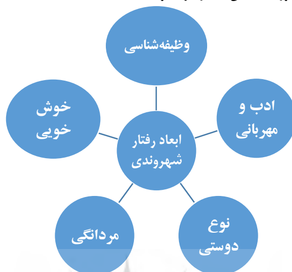
شکل ۱. حیطه‌های رفتار شهروندی سازمانی

بودند از: متغیرهای مرتبط با شغل نظیر رضایت‌مندی شغلی، یکنواختی شغلی و باز خود شغلی درخصوص متغیرهای شغلی تحقیقات عمدتاً حول مبحث تئوری جانشین‌های رهبری بوده