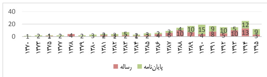
نمودار ۱. وضعیت رساله و پایان نامه‌های مقاطع تحصیلات تکمیلی در ۴ دانشگاه منتخب تهران به تفکیک سال

تعداد افراد مشارکت کننده. این پارامتر نشان دهنده تعداد اساتید مشارکت کننده در هر پایان نامه و رساله است. مجموعاً ۴۸۱ نفر از اساتید در قالب راهنما و مشاور مشارکت داشتند. ۸۴ اثر دارای استاد راهنما و استاد مشاور بوده است. ۱۰۳ اثر به جز استاد راهنما، دارای ۲ مشاور بوده است و ۱ اثر نیز دارای ۲ استاد راهنما و ۲ مشاور بوده است. با توجه به تعداد ۸۳ رساله مقطع دکتری و ۱۰۵ پایان نامه مقطع کارشناسی ارشد، می توان گفت ۲۱ پایان نامه مقطع کارشناسی ارشد دارای ۲ مشاور بوده است (جدول ۴).