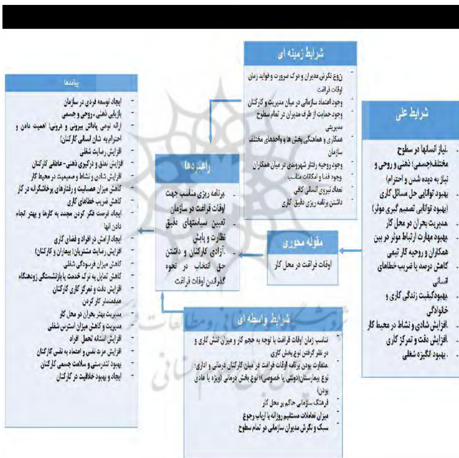
شکل ۱: الگوی پارادایمی مدیریت اوقات فراغت کارکنان در محیط کار

بر اساس نتایج بخش کیفی مدل کلی مدیریت اوقات فراغت کارکنان در محل کار در بیمارستان های منتخب شهر شیراز در شکل ۱ نشان داده شده است.