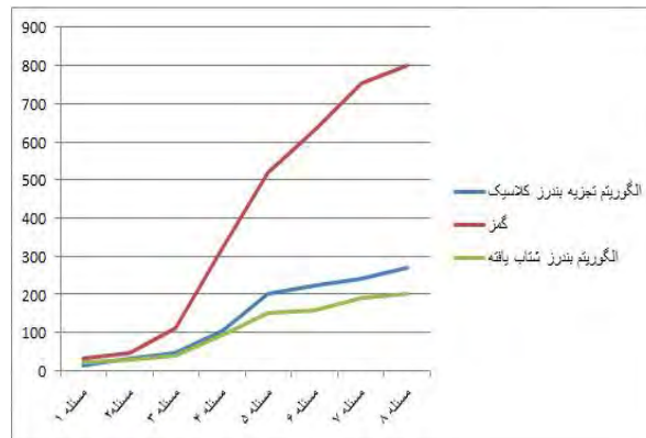
شکل ۴. مقایسه زمان حل توسط نرم‌افزار گمز و الگوریتم بندرز