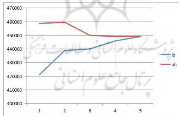
شکل ۳. نحوه همگرایی الگوریتم بندرز کلاسیک به جواب بهینه