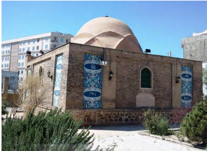
۲۶ فروردین ۱۳۹۴