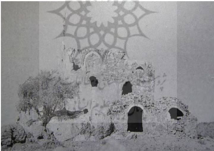
نمایی از آرمگاه جوانمرد علی قصاب قبل از تخریب و مربوط به سال ۱۳۷۲

در ری باقی نمانده است. تاریخ مقبره ری دست کم به نیمه اول قرن هشتم می‌رسد زیرا حمدالله مستوفی (م ۷۵۰) در نزهة القلوب از این مقبره یاد کرده است. البته عبدالرزاق سمرقندی در مجمع سعدین و مطلع بحرین ضمن وقایع ۸۶۴ از مدفنی منسوب به جوانمرد قصاب در سرخس یاد کرده است اما جستجوی نگارنده درباره وجود چنین بنایی در سرخس امروزی، بی‌نتیجه ماند. البته مزارات دیگری در ایران امروز به جوانمرد قصاب منسوب است مثلاً مزار جوانمرد علی در منطقه بلهرات، نزدیک روستای جنداب (در ۴۵ کیلومتری جنوب شهر عشق آباد و در ۶۵ کیلومتری جنوب شهر نیشابور) که در بین مردم به جوانمرد علی قصاب مشهور است. این مزار که از آثار اوایل دوره تیموری است با شماره ۱۵۴۷ در فهرست آثار ملی ایران به ثبت رسیده است.