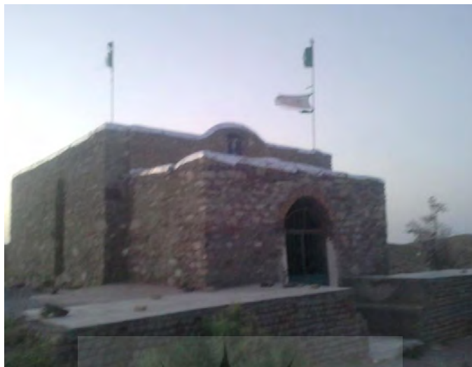
نمایی از ساختمان تازه ساز بقعه جوانمرد علی ۳ تیر ۱۳۹۲