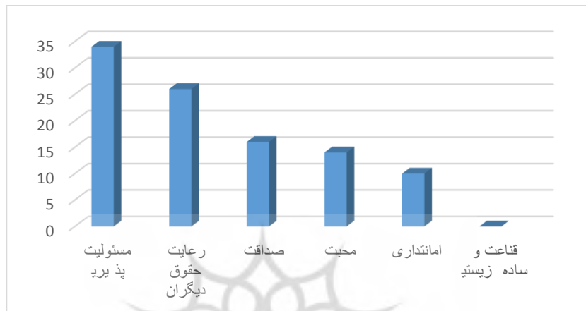
شکل ۲- فراوانی مولفه‌های تربیت اخلاقی در کتاب تفکر و سبک زندگی پایه هشتم سال تحصیلی ۹۷-۹۶ (نگارنده، ۱۳۹۸)