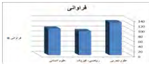
شکل ۲- توزیع فراوانی مربوط به متغیر رشته‌ی تحصیلی دانش‌آموزان

براساس جدول شماره‌ی (۲)، مشخص می‌گردد که ۱۳۰ نفر از افراد نمونه‌ی مورد مطالعه (۰/۳۹٪) در رشته‌ی تحصیلی علوم تجربی مشغول به تحصیل بوده‌اند که بیشترین درصد را به خود نسبت داده‌اند. همچنین، مشخص شد که ۹۵ نفر (۰/۲۹٪) از دانش‌آموزان در رشته‌ی ریاضی- فیزیک و ۱۰۵ نفر (۰/۳۲٪) نیز در رشته‌ی علوم انسانی مشغول به تحصیل بوده‌اند.