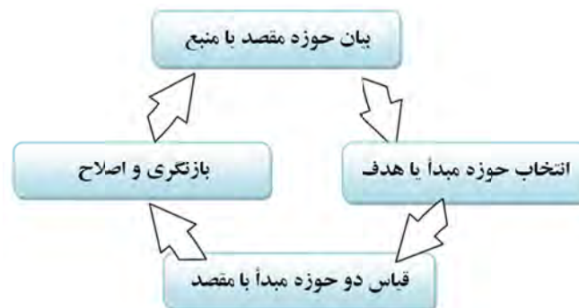
شکل ۳- مراحل الگوی آموزش تفکر خلاق مبتنی بر استعاره مفهومی

طبق جدول فوق در مرحله اول فراگیران با مقصد یا منبع موضوع روبه رو می شوند. در مورد آن فکر می کنند و آن را خوب توضیح می دهند. مثلاً در اینجا موضوع نوشتن درباره «زندگی» است. «زندگی» در این بخش مقصد یا منبع می