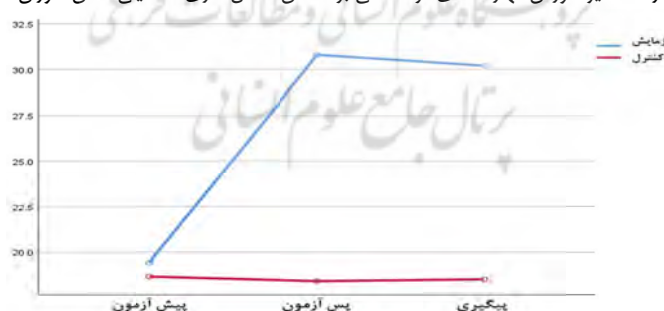
نمودار ۲- تاثیر آموزش مهارت های فراشناختی بر افزایش نمرات تاخیر در رضامندی تحصیلی دانش آموزان

کاهش یافته است ولی در گروه کنترل سطح نمرات همچنان در سطح اولیه باقی مانده است و تغییر چندانی نداشته است. تحصیلی دانش آموزان متوسطه انجام گرفت. نتایج بدست آمده نشان داد که تفاوت دو گروه آزمایش و کنترل در اهمال کاری تحصیلی در مراحل پس آزمون و پیگیری معنادار است. بنابراین مشخص گردید که آموزش مهارت های فراشناختی منجر به کاهش اهمال کاری تحصیلی از سوی دانش آموزان می شود. بدین معنی که آموزش مهارت های فراشناختی