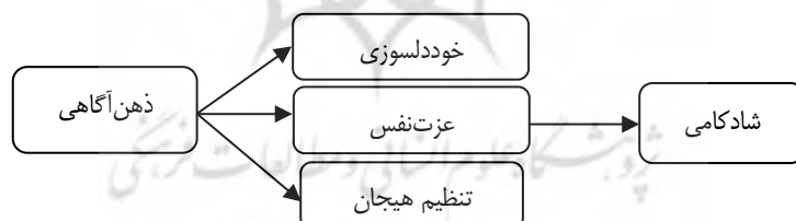
شکل (۱) مدل شادکامی در دانشجویان

در خصوص ارتباط متغیرهای پیش بین با شادکامی، کوالکاگنی و سالانوا در پژوهشی (۲۰۱۷) تأثیر ذهن آگاهی را بر شادکامی معنادار گزارش کردند. بنزو، کیرش و نلسون ۲ (۲۰۱۷)، در پژوهشی نشان دادند که خوددلسوزی به واسطه ذهن آگاهی با شادکامی ادراک شده مرتبط است. نتایج پژوهش زمیر (۲۰۱۲) نشان داد که ذهن آگاهی با رضایت از زندگی رابطه دارد و این رابطه به واسطه نقش واسطه‌ای عزت نفس است. کامپوز و همکاران (۲۰۱۶) نیز ارتباط ذهن آگاهی و خوددلسوزی را با شادکامی مثبت گزارش کردند. بین تنظیم هیجان با شادکامی نیز ارتباط مثبتی گزارش شده است (گئو و کرستتler ۳ ، ۲۰۱۸). هیل ۴ (۲۰۱۵) ارتباط عزت نفس با رضایت از زندگی و شادکامی را معنادار گزارش کرد. لذا، با توجه به شواهد پژوهشی مبنی بر ارتباط متغیر ذهن آگاهی و شادکامی و نیز نقش خوددلسوزی، عزت نفس و تنظیم هیجان در شادکامی، و از سویی نقش ذهن آگاهی در این متغیرها، مدلی ارائه شده است که می‌تواند در تبیین میزان شادکامی دانشجویان مؤثر باشد.