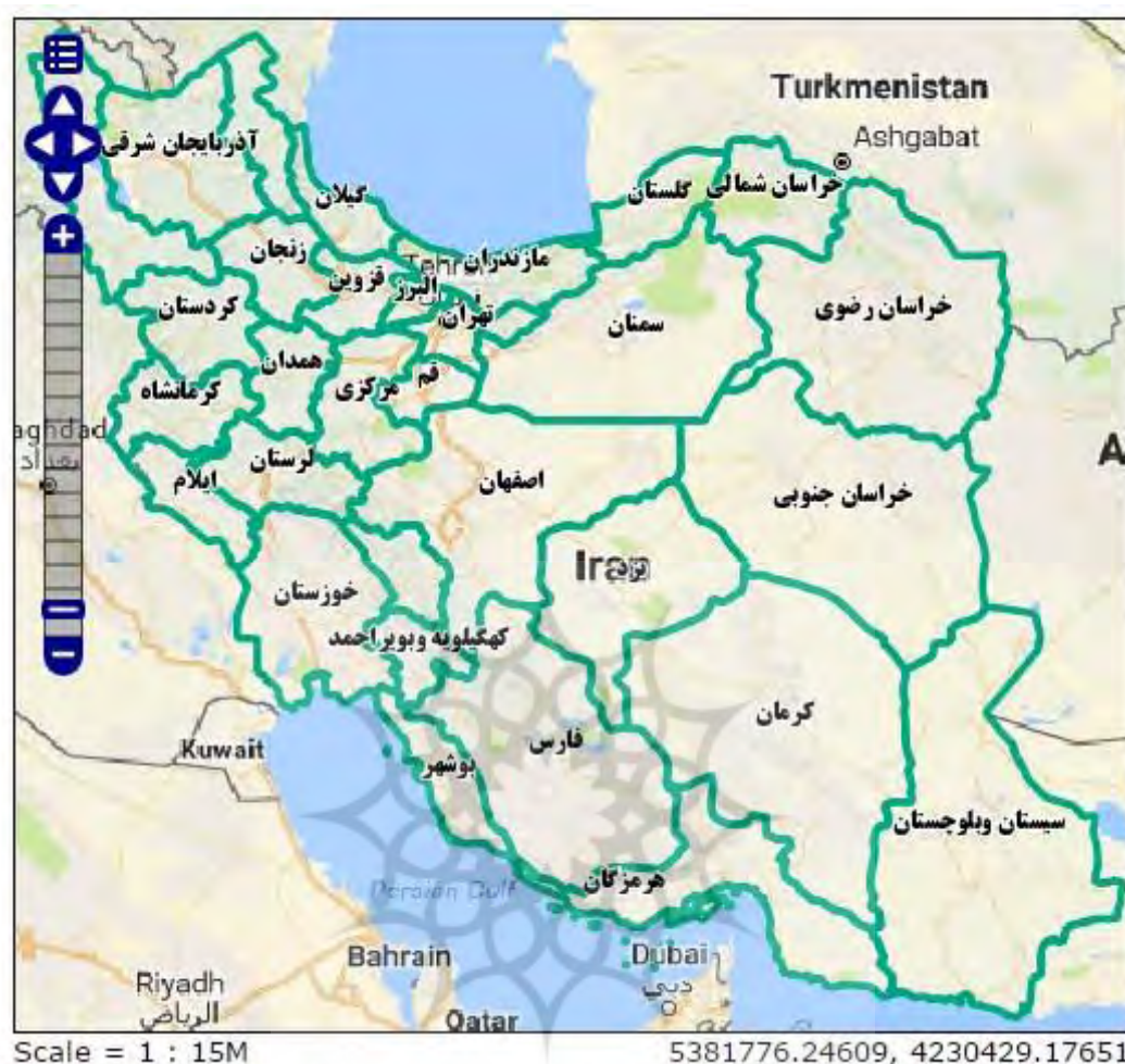
نقشه شماره ۱: نقشه ایران ( http://tsm.ncc.org.ir )

شده است که با جداسازی فضاها و اختصاص فضاهای مخصوص بانوان به نوعی امکان بهره گیری آنها از برخی فضاها تسهیل و افزایش یابد.