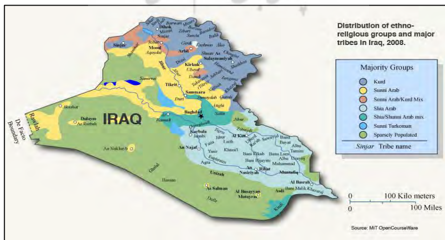
نقشه ۲- جغرافیای اقوام عراق ۲۰۱۷، Esmail Pour Roshan

بازیگران مهم و تأثیرگذار در سطح دولت مرکزی عراق را می توان به سه دسته اصلی شیعیان، کردها و اعراب سنی تقسیم کرد. معیار این تقسیم بندی، وجود شکاف اجتماعی بزرگ و سنتی در عراق است. نخستین شکاف، نژادی است که عراق را به دو جامعه کرد و عرب تقسیم کرده و شکاف دوم، مذهبی است که موجب تشکیل دو جامعه شیعه و سنی شده است. بر این اساس جامعه عراق به سه بخش تقریباً مجزا و قابل تفکیک عرب شیعه، عرب سنی و کرد تقسیم شده است (Bagheri, 2013: 139).