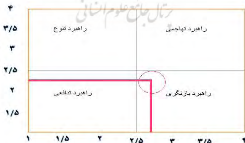
شکل (۳) - ماتریس ارزیابی نهایی عوامل داخلی و خارجی مؤثر بر چالش‌های مدیریتی کلانشهر تهران با رویکرد مدیریت یکپارچه شهری

الف) جمع امتیاز نهایی ماتریس ارزیابی عوامل داخلی که بر روی محور X ها نشان داده می‌شود؛ و ب) جمع امتیاز نهایی ماتریس ارزیابی عوامل خارجی که بر روی محور Y ها نوشته می‌شود (ابراهیم‌زاده و همکاران، ۱۳۹۰: ۱۲۱). در پژوهش حاضر، جمع امتیاز نهایی ارزیابی عوامل داخلی مؤثر بر ایجاد مدیریت یکپارچه در کلانشهری تهران (۲/۶۷) می‌باشد، بر روی محور X ها و جمع امتیاز نهایی عوامل خارجی مؤثر بر ایجاد مدیریت یکپارچه در کلانشهری تهران (۲/۲۵) می‌باشد، بر روی محور Y ها نشان داده شده است که نقطه تلاقی آن‌ها مشخص کننده نوع راهبرد می‌باشد شکل (۳). همان‌طوری که مشخص است نقطه تلاقی جمع امتیازهای نهایی عوامل داخلی و خارجی، در خانه راهبرد بازنگری قرار گرفته است بنابراین باید راهبردهای بازنگری را به اجرا درآورد که به سبب آن باید تمام تلاش در جهت کاهش نقاط ضعف درونی مدیریت یکپارچه در کلانشهر تهران با بهره‌گیری از فرصت‌های بیرونی است.