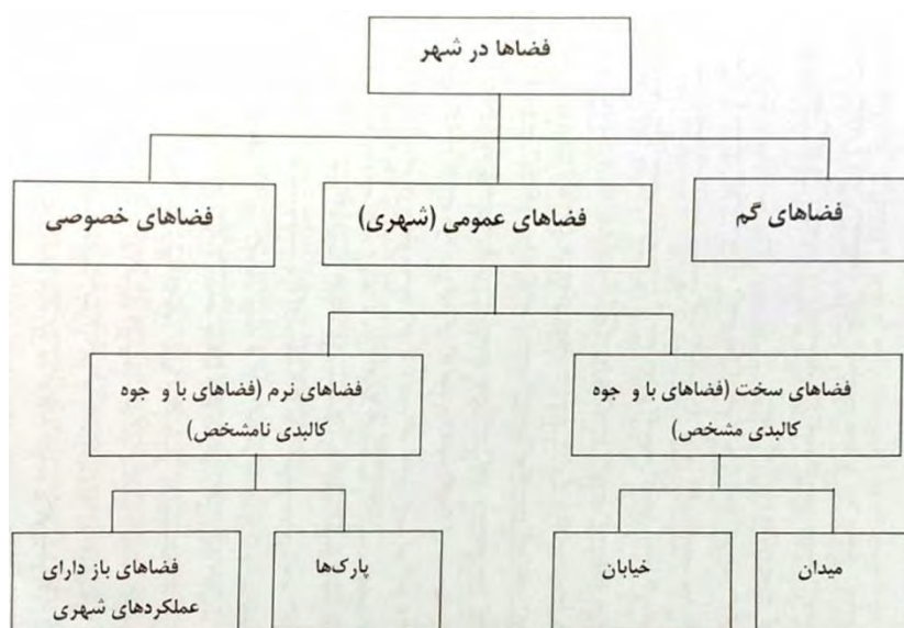
نمودار (۲): مدل فضاهای شهری