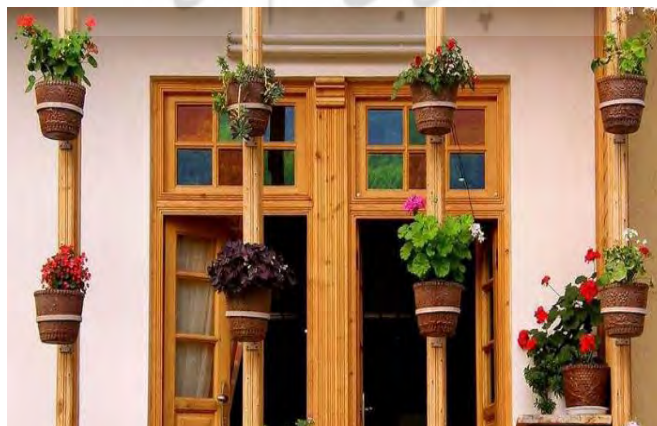
تصویر شماره ۳: نمایی از یک خانه در ماسوله

امروزه واحدهای ساختمانی تشکیل دهنده بافت تاریخی شهر ماسوله، مشتمل بر بیش از ۳۵۰ خانه مسکونی می‌باشند که شاخص‌ترین ویژگی آن‌ها هم جواری آنهاست. این هم جواری به گونه‌ای در نظر گرفته شده که باعث می‌شود تمام خانه‌ها زنجیروار و به هم پیوسته در امتداد خطوط توپوگرافی زمین قرار داشته باشند. هر واحد مسکونی نیز بین یک تا چهار طبقه دارد که بیش از ۷۰٪ آن‌ها به صورت دو طبقه احداث شده‌اند. به طور معمول پائین‌ترین طبقه غیر مسکونی بوده و کاربرد آن‌ها انبار و طویله است. راهروی ورودی خانه نیز در این طبقه واقع است. طبقات فوقانی نیز شامل فضاهای مسکونی بوده‌اند. طبقه پائین از مصالح سنگی و طبقات فوقانی از خشت بنا ساخته شده‌اند. این معماری به گونه‌ای سازگار با شرایط اقلیمی، توپوگرافیکی و اجتماعی، فضاهای داخلی تقریباً یکسانی را شامل می‌شده‌اند.