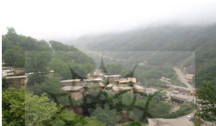
تصویر شماره ۱: نمایی از شهر ماسوله

ماسوله‌ی قدیم یا «کهنه ماسوله» که در فاصله «هشت کیلومتری غرب جاده ماسوله به خلخال» قرار گرفته است سکونتگاه اصلی و اولیه مردم ماسوله بوده است که اکنون آنچه در این مکان به چشم می‌خورد سنگ دیوار بناهای آن است. در نخستین کاوش‌های باستان‌شناسی شهرستان فومن که در شهریور ماه ۱۳۷۴ توسط هیئت پژوهشکده باستان‌شناسی سازمان میراث فرهنگی استان گیلان در این محوطه صورت گرفت مشخص شد که از سده پنجم تا هشتم هجری «کهنه ماسوله» به عنوان یکی از مراکز مهم در زمینه فلزکاری بوده است. همچنین سفال‌های لعابدار با رنگ‌های متنوع که مشخصات دوره سلجوقی را داشته‌اند در این منطقه کشف و این ناحیه به دلیل اهمیت و اعتبار تاریخی آن در شهریور ۱۳۸۵ در فهرست آثار ملی ثبت شد.