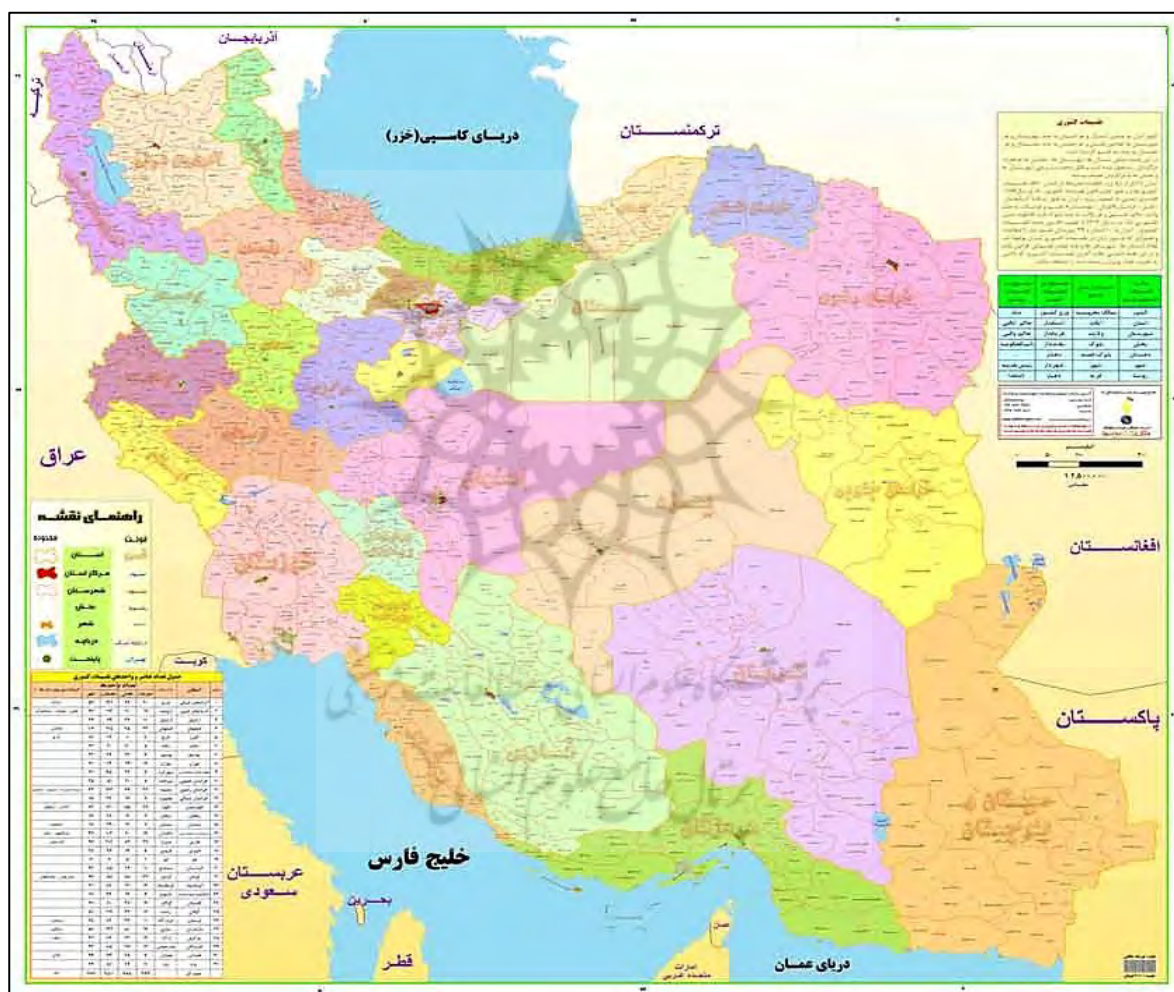
نقشه شماره ۱- تقسیمات سیاسی کنونی ایران

بلند، رخنه عوامل غیررسمی در نظام تقسیمات کشوری و شکل‌گیری رقابت‌های ناحیه‌ای و محلی، نبود ساخت و کار بهینه برای مشارکت دادن گروه‌های قومی، زبانی و مذهبی (بی‌توجهی به جغرافیای فرهنگی)، عدم عدالت فضایی و مشخص نبودن دقیق مدیران و اداره کنندگان واحدهای سیاسی است. سؤال اصلی مقاله این است که نظام تقسیمات کشوری در ایران به طور کلی و به ویژه در استان سمنان دارای چه مبانی و ویژگی‌های جغرافیایی است؟ می‌توان گفت که متغیرهای جغرافیای طبیعی (زمین، آب و هوا، آب‌ها، خاک‌ها و سایر پدیده‌های طبیعی) و انسانی (-پراکنده‌گی انسان و فعالیت‌های اجتماعی، فرهنگی، اقتصادی و سیاسی او) و رابطه‌ی بین این دو دسته از متغیرها و ساماندهی این رابطه و مدیریت و اداره این رابطه علت و العلل ساماندهی سیاسی فضا در یک کشور است ( etaat and Mousavi, 2008: 57).