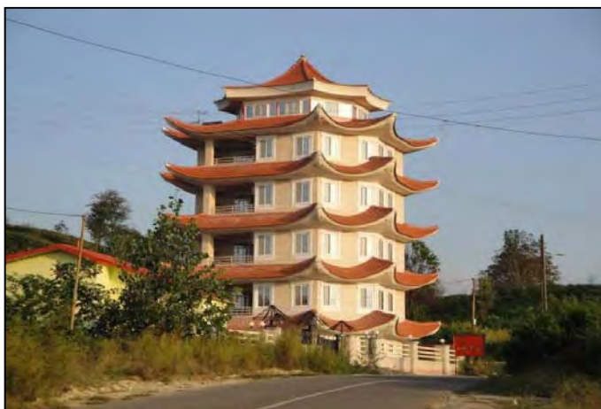
شکل شماره ۲- نمایی از تغییر کاربری باغات چای در روستای کوه بیجار