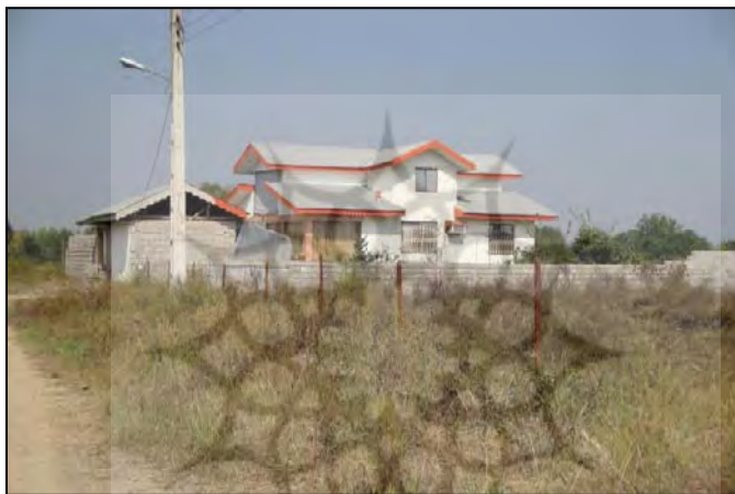
شکل شماره ۳- نمایی از تغییر مزارع برنج در روستای گوکه