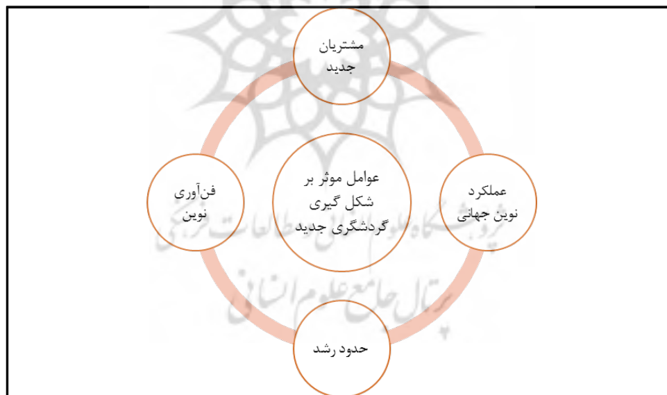
نمودار شماره ۱- عوامل موثر در شکل‌گیری گردشگری جدید

به طور کلی مطابق با نمودار شماره یک چهار عامل عمده در شکل‌گیری گردشگری جدید را می‌توان به صورت زیر بیان کرد: