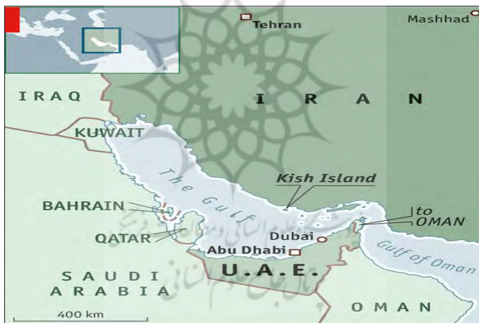
نقشه شماره ۱- موقعیت جزیره کیش

جزیره کیش که به مروارید خلیج فارس مشهور است با مساحتی حدود ۹۱ کیلومتر مربع در هیجده کیلومتری کرانه جنوبی سرزمین ایران قرار دارد. این جزیره از نظر تقسیمات سیاسی، جزئی از شهرستان بندر لنگه در استان هرمزگان محسوب می‌شود و از لحاظ وسعت بعد از جزیره قشم، مقام دوم را در خلیج فارس دارا است. در اواخر سال ۱۳۷۹ بر اساس نتایج سرشماری عمومی نفوس و مسکن، جمعیت جزیره کیش ۱۶۵۰۱ نفر برآورده شده است. نتایج سرشماری سال ۱۳۷۹ نشان می‌دهد ۱۳۵۹۳ نفر یا حدود ۹۳ درصد جمعیت کیش را افرادی تشکیل می‌دهند که طی ده سال اخیر به جزیره مهاجرت کرده‌اند (Hakimian, 2009: p.3-24).