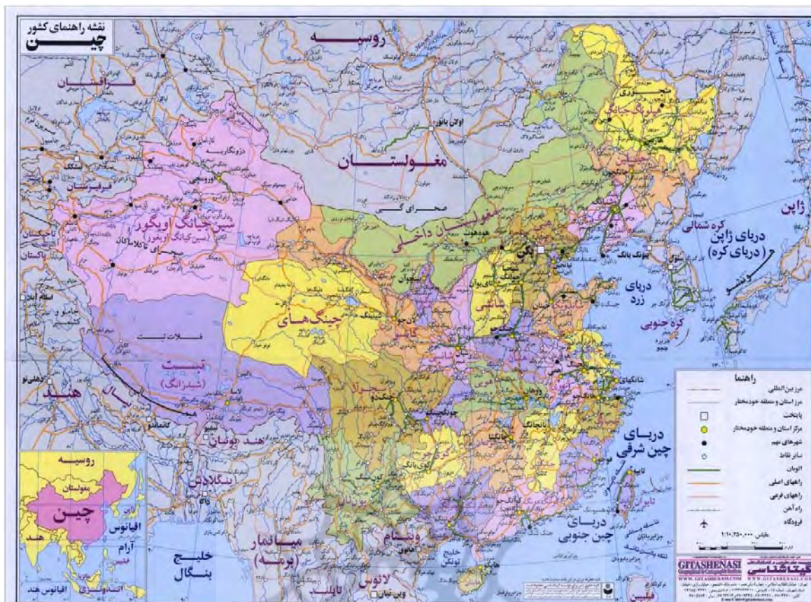
نقشه شماره ۱: نقشه کشور چین