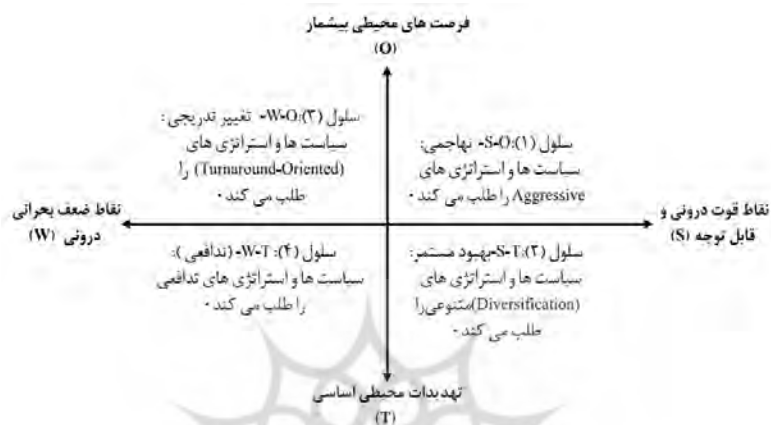
شکل شماره (۱): نمودار تجزیه و تحلیل SWOT. منبع (Wright and Priwgle, 1998:64).