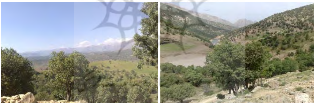
شکل شماره (۲): نمایی از کوه‌های منطقه نمونه گردشگری بازفت

۲-۱-۲- پوشش گیاهی و حیات وحش ۱ : پوشش گیاهی منطقه بازفت یکی از مهمترین جاذبه‌های آن است که برای گردشگران دیدنی و جذاب است. در این منطقه عوامل آب و هوا، نوع خاک و توپوگرافی، پوشش گیاهی متنوع و متفاوتی بوجود آورده است. بخش اعظمی از جنگل‌های منطقه بازفت را درختان بلوط در بر گرفته که چشم‌انداز زیبایی به آن بخشیده است. این جنگل‌ها در برخی نقاط از تراکم بیشتری برخوردارند. پوشش گیاهی جنگل و مرتع و قرارگیری در حاشیه رودخانه، به جذابیت بازفت افزوده است. علاوه بر بلوط در کوه‌های منطقه انواع دیگری از درختان مانند زبان گنجشک، پسته وحشی، زالزالک، گردو و... وجود دارد. منطقه بازفت به علت دارا بودن فضای کوهستانی و جنگلی، پوشش گیاهی متنوع، چشمه‌ها و رود بازفت، استعداد خوبی برای زندگی انواع جانوران دارد. از انواع وحوش و پرندگان موجود در این منطقه می‌توان قوچ، میش، کل، بز، کبک دری، کبوتر و... را نام برد (مهندسین مشاور آمایش و توسعه البرز، ۱۳۸۹: ۷۳).