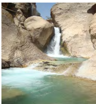
شکل شماره (۶): آبشار دم تنگ روستای تبرک علیا

۲-۱-۷- آبشار دره شیخ عالی: این آبشار در روستای دره شیخ عالی و در فاصله ۱۱ کیلومتری از روستای چم قلعه قرار دارد. منطقه‌ای که آبشار در آن واقع شده کاملاً کوهستانی بوده و بر فراز کوه‌های بلند آن، آبشار به پائین کوه سرازیر شده و منظره زیبایی بوجود آورده است. سایه‌سار درختان موجود در محل آبشار، مکان مناسبی برای استراحت گردشگران بوجود آورده است. در پایه آبشار، حوضچه‌هایی بوجود آمده که بر زیبایی آن افزوده است و قابلیت ایجاد مکان مناسبی برای شناکردن را بوجود آورده است (مهندسین مشاور آمایش و توسعه البرز، ۱۳۸۹: ۸۰).