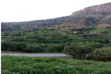
شکل شماره (۴): تصویری از باغها و مزارع کشاورزی منطقه نمونه گردشگری بازفت

۲- ۱- ۴- رودخانه بازفت: این رودخانه از دامنه کوه‌های منار، گله سگا، تورگ و زردکوه در ۱۲۰ کیلومتری شمال باختری شهرکرد سرچشمه می‌گیرد و در یک کیلومتری جنوب خاوری روستای کبوسی به رود کارون می‌ریزد. ارتفاع سرچشمه این رود ۲۷۵۰ متر، ارتفاع ریزشگاه آن حدود ۸۵۰ متر و شیب متوسط آن ۲ درصد است. رودخانه بازفت در حوزه منطقه نمونه گردشگری، چشم‌انداز بسیار زیبایی به وجود آورده به طوری که بسیاری از گردشگران، حاشیه این رودخانه را مکانی مناسب برای تفریح و تفرج خود می‌دانند. وجود رودخانه بازفت امکان ایجاد و توسعه ورزش‌های آبی و توسعه گردشگری بر پایه فعالیت‌های آبی از قبیل ماهیگیری، شنا و قایق سواری را بوجود آورده است و فرصت مناسبی پیش روی سرمایه‌گذاران نهاده است (مهندسین مشاور آمایش و توسعه البرز، ۱۳۸۹: ۷۵).