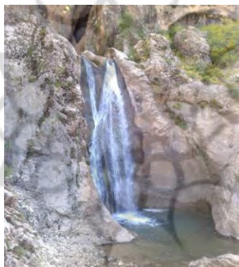
شکل شماره (۷): تصویری از حوضچه آبشار

۲-۱-۷- آبشار دره شیخ عالی: این آبشار در روستای دره شیخ عالی و در فاصله ۱۱ کیلومتری از روستای چم قلعه قرار دارد. منطقه‌ای که آبشار در آن واقع شده کاملاً کوهستانی بوده و بر فراز کوه‌های بلند آن، آبشار به پائین کوه سرازیر شده و منظره زیبایی بوجود آورده است. سایه‌سار درختان موجود در محل آبشار، مکان مناسبی برای استراحت گردشگران بوجود آورده است. در پایه آبشار، حوضچه‌هایی بوجود آمده که بر زیبایی آن افزوده است و قابلیت ایجاد مکان مناسبی برای شناکردن را بوجود آورده است (مهندسین مشاور آمایش و توسعه البرز، ۱۳۸۹: ۸۰).