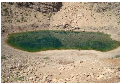
شکل شماره (۸): نمایی از چاه سبزان

۲-۱-۸- چاه سبزان: منطقه چاه سبزان در طول مسیر منطقه نمونه گردشگری بازفت، در فاصله ۴۵ کیلومتری چم قلعه قرار گرفته است و در مجاورت جاده آسفالتی قرار دارد. سبزی رنگ آب چاه دلیل نامگذاری آن به چاه سبزان است که در نوع خود زیبا و دیدنی می‌باشد. منشأ پیدایش آب چاه هنوز مشخص نشده و یکی از نکات قابل توجه در ارتباط با چاه سبزان، مشخص نبودن منشأ آن است. در مجاورت این چاه، پوشش گیاهی وسیعی از گون و خیش مورد وجود دارد که در پهنه مقابل چاه سبزان گسترده شده‌اند (همان، ۸۰).