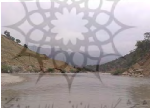
شکل شماره (۵): نمایی از رودخانه بازفت

۲- ۱- ۴- رودخانه بازفت: این رودخانه از دامنه کوه‌های منار، گله سگا، تورگ و زردکوه در ۱۲۰ کیلومتری شمال باختری شهرکرد سرچشمه می‌گیرد و در یک کیلومتری جنوب خاوری روستای کبوسی به رود کارون می‌ریزد. ارتفاع سرچشمه این رود ۲۷۵۰ متر، ارتفاع ریزشگاه آن حدود ۸۵۰ متر و شیب متوسط آن ۲ درصد است. رودخانه بازفت در حوزه منطقه نمونه گردشگری، چشم‌انداز بسیار زیبایی به وجود آورده به طوری که بسیاری از گردشگران، حاشیه این رودخانه را مکانی مناسب برای تفریح و تفرج خود می‌دانند. وجود رودخانه بازفت امکان ایجاد و توسعه ورزش‌های آبی و توسعه گردشگری بر پایه فعالیت‌های آبی از قبیل ماهیگیری، شنا و قایق سواری را بوجود آورده است و فرصت مناسبی پیش روی سرمایه‌گذاران نهاده است (مهندسین مشاور آمایش و توسعه البرز، ۱۳۸۹: ۷۵).