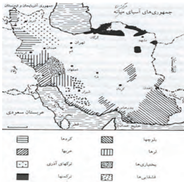
نقشه شماره ۱: محل تمرکز عمده گروه‌های زبانی در ایران