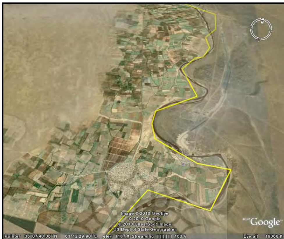
شکل ۴: تغییر مسیر ناگهانی هریرود به صورت ماندن در اثر تشدید کاربری به سمت خاک جمهوری اسلامی ایران در سرخس (نمونه‌ای از تغییر خط مرز در منطقه)