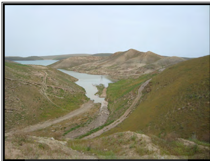
شکل ۳: آثار پیشروی هریرود تا مجاور جاده مرزی سرخس - پل خاتون