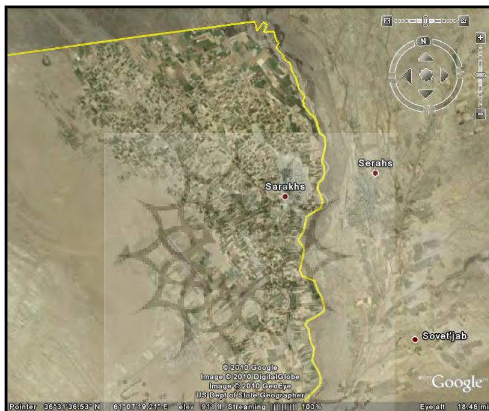
شکل ۱: کاربری شدید زمین تا نقطه صفر مرزی در سرخس جمهوری اسلامی ایران

رودخانه هریرود از دشت همدم آباد افغانستان وارد مرز ایران - افغانستان در محل پیش رباط شده و اگر دارای مآندرهایی در این قسمت می‌باشد ولی تراکم مآندرها از پل خاتون تا شرق یازتپه سرخس است. فعالیت گسل هریرود و توپوگرافی و سیلاب‌های بهاره این رودخانه بر سست شدن دیواره بستر رودخانه موثر می‌باشند. ولی مهم‌تر از همه کشت کردن زمین تا حاشیه رودخانه یعنی نقطه صفر مرزی و تخریب پوشش گیاهی است که منجر به تحولات مورفودینامیک بستر هریرود شده است.