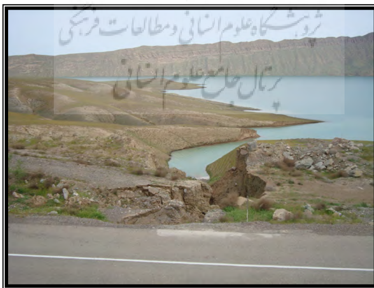
شکل ۲: پیشروی هریرود به طرف مرز سرخس و تخریب جاده مرزی