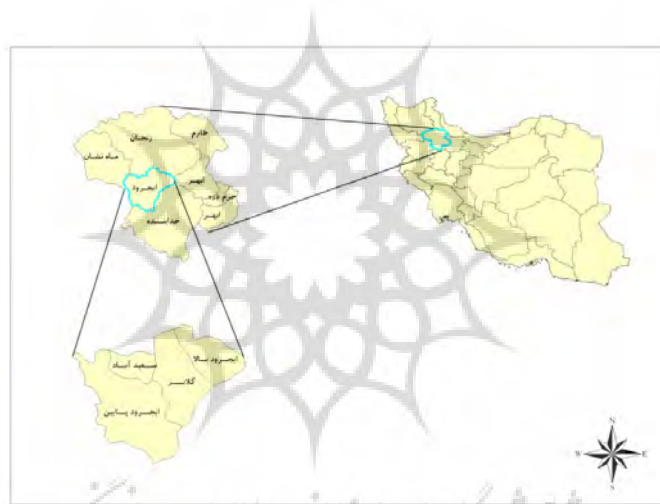
نقشه شماره ۱: محدوده جغرافیایی شهرستان ایجرود

شهرستان ایجرود به‌عنوان یکی از شهرستان‌های استان زنجان، ۷درجه ۴۹دقیقه تا ۸درجه ۳۵دقیقه عرض شمالی و ۳۶درجه ۵دقیقه تا ۳۶درجه ۳۴دقیقه طول شرقی را قرار گرفته است (سازمان برنامه بودجه، ۱۳۷۶: ۳). شهرستان ایجرود حدود ۱۸۲۹ کیلومتر مربع مساحت دارد. از سمت شمال و شمال غرب به شهرستان‌های زنجان و ماهنشان، از سمت شرق به شهرستان ابهر، از جنوب و جنوب شرق به شهرستان خدابنده و از سمت غرب با استان کردستان همجوار است. این شهرستان از نظر ارتباطی در مسیر جاده زنجان به کردستان و در فاصله ۳۵ کیلومتری مرکز استان واقع شده است.