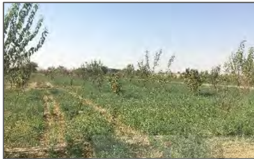
شکل ۳. تغییر کاربری شالیزار به باغ میوه در ناحیه لنجان سفلی

وجود آمده در فرایند تولید کشاورزی را به مثابه ناپایداری الگوی کشت ارزیابی می‌نمایند که پیامد آن تغییر و تخریب اراضی، تضعیف نظام اقتصاد کشاورزان و در نهایت افزایش مهاجرفرستی و تخلیه‌ی روستاهاست (شکل ۲ و ۳). درک تغییرات به وجود آمده به مثابه‌ی ناپایداری الگوی کشت در ناحیه روستایی لنجان در قالب یک مدل زمینه‌ای شامل عوامل تأثیرگذار / کنترل‌کننده، تأثیرات اولیه، تغییر ایجاد شده، پیامدهای اولیه و پیامد ثانویه در شکل ۴ ارائه شده است.