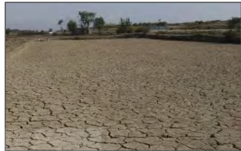
شکل ۲. عدم کشت و رهاسازی شالیزار در ناحیه لنجان علیا