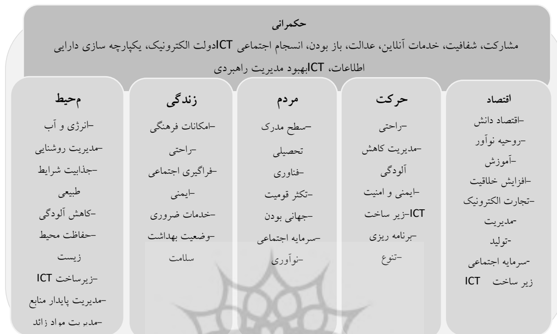
شکل ۱. ابعاد و معیار شهر هوشمند

رقابت‌های اقتصادی شهر هوشمند می‌شوند (کلداهی و همکاران، ۲۰۱۳، ص. ۲۲).