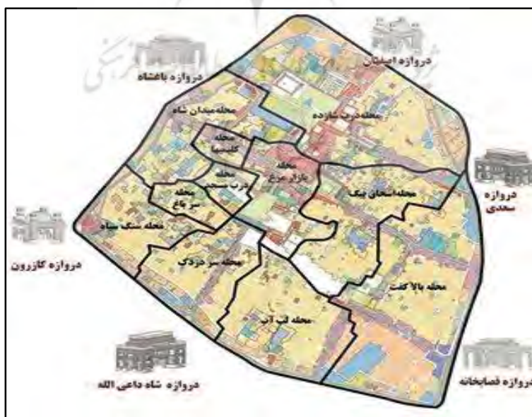
شکل ۲- محله بندی عرفی منطقه هشت شهر شیراز