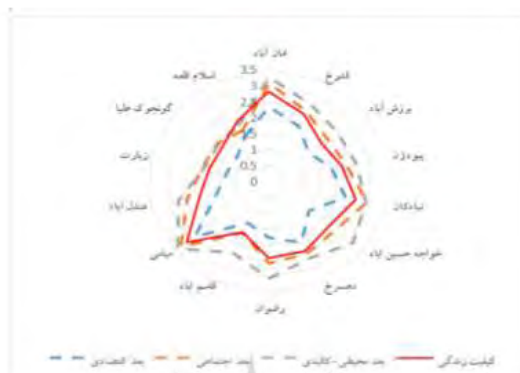
شکل ۳- رادار نقش گردشگری بر سازه کیفیت زندگی و ابعاد آن