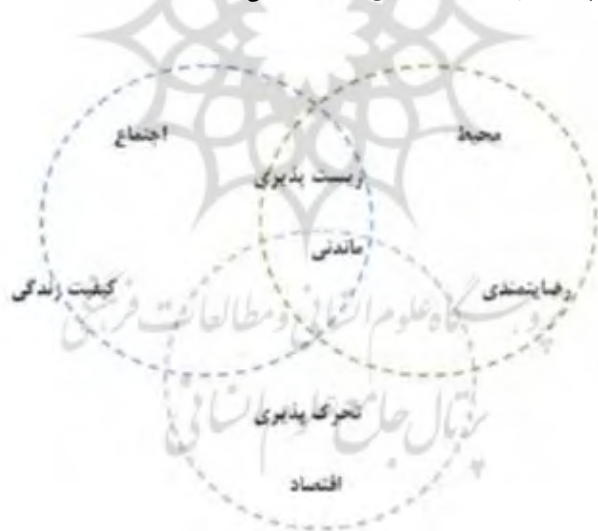
شکل ۲- مدل عوامل سهیم در کیفیت زندگی از دیدگاه اکولوژی انسانی

و پایداری (ماندنی) در ارتباط متقابل با همدیگر بیان شده است (وان کمپ، لیدرمرجر، میسون و دی هولاندر ۱ ، ۲۰۰۳، ص. ۱۱) که زیست‌پذیری نتیجه تأمین مطلوب محیطی و اجتماعی است و بیشتر از نظر زمانی، نگاه به حال حاضر دارد، اما پایداری بیشتر متأثر از جنبه‌های محیطی است که از نظر زمانی نگاه به آینده دارد. در واقع می‌توان حوزه‌های اجتماعی-محیطی-اقتصادی را به عنوان سه رکن اصلی کیفیت زندگی در نظر گرفت. لازم به ذکر است محققان و صاحب‌نظران متعددی کیفیت زندگی را در ابعاد اجتماعی، محیطی و اقتصادی مورد بررسی قرار داده‌اند. به عقیده مایرس ۲ کیفیت زندگی ریشه در کفایت اقتصادی، محیطی و الزامات اجتماعی دارد (مایرس، ۱۹۸۷، ص. ۱۵۱) و عبارت است از شرایط اجتماعی، فرهنگی، اقتصادی و کالبدی-فضایی (خواجه شاهکوهی، مینایی، ۱۳۹۳، ص. ۵) به رغم تکثرگرایی مفهومی و عملیاتی، کیفیت زندگی عموماً یک مفهوم چندبعدی است (مک‌گیلوری ۳ ، ۲۰۰۶، ص. ۴۱) که با توسعه اقتصادی-اجتماعی و بهبود و بهسازی سطوح زندگی اهمیت می‌یابد و ویژگی‌های کلی اجتماعی، اقتصادی محیط در یک ناحیه را نشان می‌دهد (محمدپورجباری، ۱۳۹۳، ص. ۳۸) (شکل ۲).