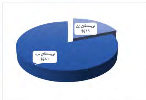
نمودار ۲. توزیع فراوانی میزان مشارکت زنان و مردان

پرسش پنجم به بررسی میزان مشارکت زنان و مردان در تولید مقالات XBRL اختصاص دارد. یافته‌های مربوط به بررسی این پرسش در نمودار ۲، ارائه شده است.