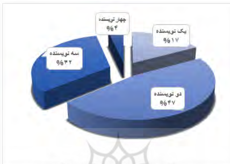
نمودار ۳. میزان مشارکت علمی نویسندگان در انتشار مقالات

به‌طور کلی ۱۱۱ نفر محقق در تولید آثار علمی در حیطه XBRL مشارکت داشته‌اند که از این تعداد، ۹۰ نفر مرد (۸۱ درصد) و ۲۱ نفر زن (۱۹ درصد) بوده است که در نمودار ۲، نشان داده شده است. پرسش ششم پژوهش به بررسی همکاری محققان (تعداد نویسندگان) در تولید مقالات XBRL پرداخته است که نمودار شماره ۳، سهم هر کدام از آنها را نشان می‌دهد.