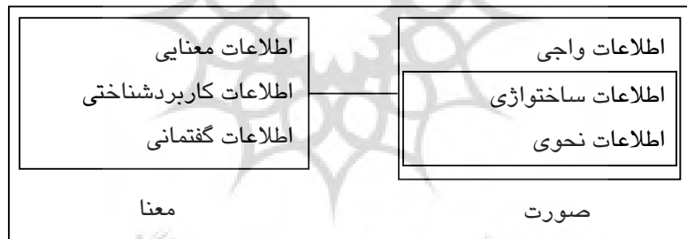
شکل ۱: ساخت و دو بخش معنایی و صوری آن (Booij, 2016: 427)

همان‌گونه که پیشتر گفته شد، در رویکرد ساخت‌بنیاد هم الگوهای واژه‌سازی و هم الگوهای نحوی هر دو «ساخت» به‌شمار می‌آیند. ساخت عبارت است از یک جفت صورت و معنا که یادآور همان مفهوم «نشانه» در دیدگاه سوسوری است. با این تفاوت که سوسور مفهوم نشانه را تنها برای واژه‌ها به‌کار می‌برد؛ اما رویکرد ساخت‌بنیاد همه واحدهای واژگانی و نحوی زبان با درجات پیچیدگی گوناگون را ساخت می‌داند. از این رو، ساخت دارای دو بخش است: بخش معنایی و بخش صوری. بخش صوری ساخت‌ها شامل ویژگی‌های ساخت‌واژی - نحوی ۱۸ و ویژگی‌های واجی است، در حالی که بخش معنایی دربرگیرنده ویژگی‌های معنایی، کاربردشناختی و گفتمانی است. همه این اطلاعات و ویژگی‌های در پیوند با یک ساخت را می‌توان در نمودار شماره ۱ نشان داد: