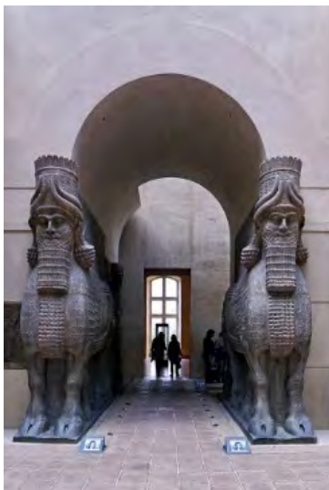
تصویر ۸ لاماسو، مکشوفه از خرساباد

به‌طور کلی بیکره‌های مکشوفه از خرساباد به صورت ظریف‌تر طراحی و حجاری شده‌اند. با این‌که لاماسوهای کاخ نیم‌رود از خرساباد الهام گرفته‌اند، اما از نظر تناسباتی این بیکره‌ها کمی کوچک‌تر، ولی از نظر پویایی بدنه بیکره و نوع گام برداشتن و تصور راه رفتن، با ظرافت بیشتری حجاری شده‌اند. و همچنین شاهد توجه بیشتر در پیش موها، و حلقه کردن آن هستیم (Danrey, 2004: 3). در بعضی از نمونه‌ها موها به صورت گرد شده بر روی شانه انداخته شده. و بیشتر شبیه به موی پیچیده شده و یا بافته است. اما در بعضی از لاماسوها کاملاً بر عرض شانه‌ها قرار گرفته و به راحتی پیداست که موها باز گذاشته شده‌اند و به‌طور مرتب شانه‌ها را پوشانده است. استفاده از این همه جزئیات و ریزه‌کاری‌ها در نحوه آرایش موها، قرار دادن کلاه یا تاج، و ریش لاماسوها نشان می‌دهد که هنرمندان آشوری در استفاده از جزئیات برای بیکره‌سازی مهارت ویژه‌ای داشتند. و سرانجام با نگاهی به اندازه این مجسمه‌های غول‌پیکر در ورودی کاخ دور-شاروکین که با چهار متر بلندی ساخته شده‌اند (استیل، ۱۳۹۰: ۷۳)، خواهیم فهمید که آنان حقیقتاً محافظانی با عظمت بوده‌اند (تصویر ۸).