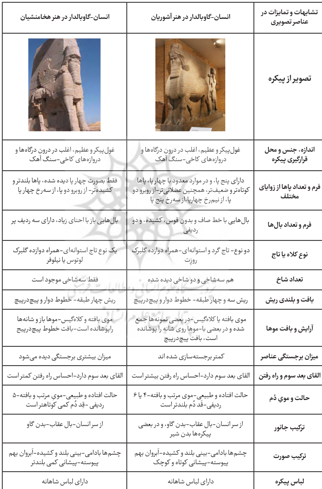
جدول ۱. عناصر تطبیقی انسان-گاو بالدار در هنر آشوریان و هخامنشیان.