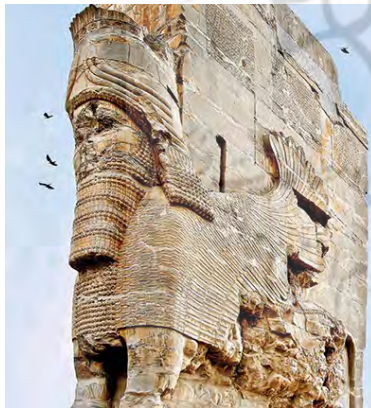
تصویر ۱۳ تخت جمشید، دروازه ملل گاوبالداری با سر انسان، تمدن هخامنشی