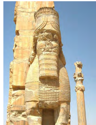
تصویر ۱۱ لاماسوس، از روبرو، دروازه ملل