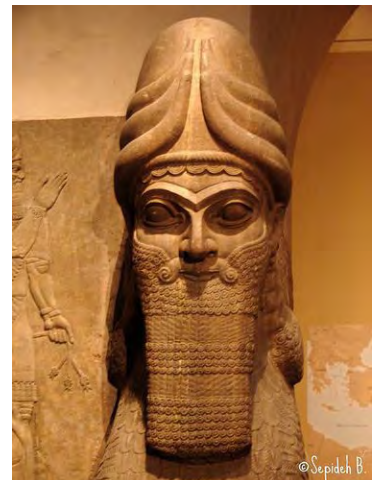
Figure 2 Head of lamassu with a round crown