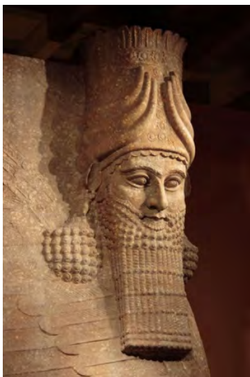
تصویر ۴ سر لاماسو

در ابتدا باید عنوان کرد که لاماسوهای کشف شده از کاخ‌های نیمرو و خراساباد به صورت بیکره‌های کامل تراز سایر نقاط به دست آمده‌اند. بیکره‌ها دارای سر شاهی یا سرفرشتگان بوده و چهار طبقه ریش بلند دارند. در بعضی از بیکره‌ها این ریش سه طبقه و در بعضی نمونه‌ها چهار طبقه است و حتی به صورت یک نیم طبقه ریش کوچک نیز در بعضی از آن‌ها اضافه شده است. که در هنر بین‌النهرین نشان از عالی‌رتبه بودن صاحب آن می‌کند. مو و ریش مصنوعی در نقوش برجسته آشوری و همین‌طور در بیکره‌ها بسیار تکرار شده است (تصویر ۴ و ۶). علاوه بر این در هنر آشوری همواره شاه را در پناه حمایت گاوهای بالدار با چهره انسانی می‌بینیم، نمی‌توان تردید داشت که این نقوش، تصویر خود پادشاه نیز بوده‌اند، که ماهیت اسرارآمیز پادشاه، عظمت او در دسترسی ناپذیری و اعتقاد محکم او به عنوان کاهنی مذهبی، را به‌طور زنده به بیننده نشان می‌داد. از زمان سارگون ۱۴ به بعد، آشوری‌ها کلاه‌گیسی با موی بافته شده به سر می‌گذاشتند که به‌طور افقی پوشاننده شانه‌ها در راست و چپ بود. و از پشت نیز به صورت یک دسته موی پرپشت مجعد دیده می‌شد. لاماسوی آشوری ملبس به جامه معمول پادشاه آشور، شال، مو و ریش است. انسان-گاوبالدار آشوری معمولاً در چهارگوشه بنا قرار داده می‌شده که به منظور ایجاد گروه تصویری