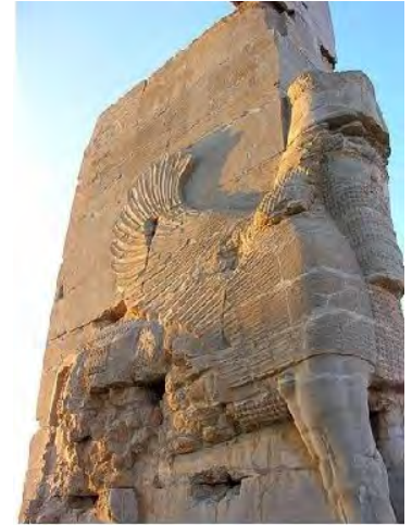
Figure 1 Lamassu, Gate of All Nations