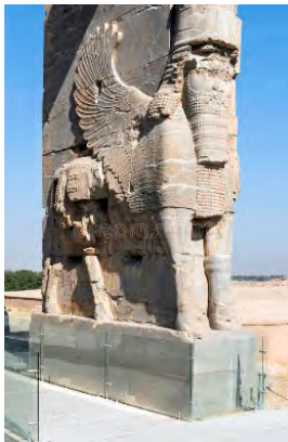
تصویر ۱۴ انسان- گاوبالداری هخامنشی

نیلوفر آبی دوازده پیر است که سمبلی از زیبایی و قدرت در دوره هخامنشی است. فره‌وشی‌ها، محافظ و نگهبان زندگی، حیات، شادی، و زیبایی در ایران زمین بودند (دادور؛ منصوری، ۱۳۸۵: ۱۴۳). در قسمت پوشش بدنه و تنه لاسوس، رختی شاهی و درباری مانند می بینیم که نشان از بزرگی مقام او و یا حتی کسی که سوار بر او خواهد شد، می‌دهد. دم پیکره، یک دم را در حالت استراحت یافته نشان می‌دهد (تصویر ۱۴). و به پایینی پای پیکره نزدیک شده است. در قسمت پایین، موی دم، دارای پنج طبقه موی بافته شده است که تا انتهای دم امتداد نیافته است (تصویر ۱۲). ریش لاسوس هخامنشی چهار طبقه، با خطوط دوار و پیچ‌درپیچ نمایش داده شده که رسمی آیینی بوده است (تصویر ۱۱). موها نیز بلند، بصورت باز و شانه شده، به روی شانه‌ها آویزان است (تصویر ۱۳). در مورد صورت پیکره و بینی، فرم آبروها، به دلیل خراب شدن پیکره هخامنشی در آن قسمت، نگارنده نمی‌تواند توضیحی دهد. و به این دلیل با رجوع به نقش برجسته اسفنگس مکشوفه از کاخ تخت جمشید، می‌توان گفت که احتمالاً صورت لاسوس هخامنشی مشابه لاسوس آشوریان بوده، چشم‌ها بادامی و کشیده و بینی صاف و بلند می‌باشد. و فاصله پیشانی تا ابروهای بهم پیوسته، کمی بیشتر از نمونه آشوری است. هنر دوره هخامنشی ویژه محیط درباری بود. زیرا امپراتوری هخامنشی از یک نظام سیاسی نیرومند برخوردار بود. و هنر آن آینه‌ای برای اقتدار این حکومت است. در چنین وضعی هنر هم مانند تمدن هخامنشی، به تجلیل شاهنشاه اختصاص یافت، که ابهت و شکوه‌مندی هنر هخامنشی را توجیه می‌کند (ضابطی جهرمی، ۱۳۹۵: ۲۹).