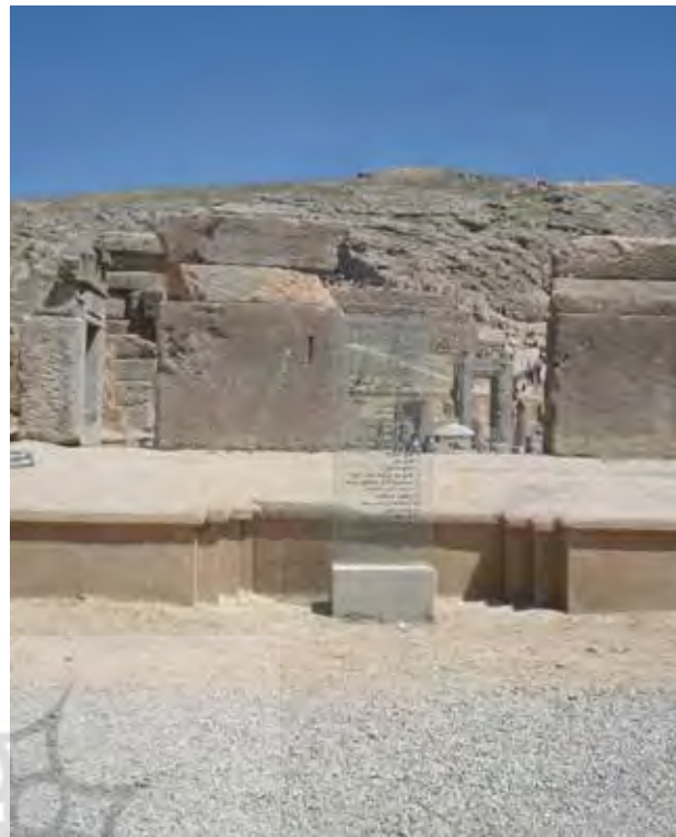
تصویر ۱۱. تابلو راهنمای شیشه‌ای تخت جمشید بدون مانع بصری منظر اطراف.