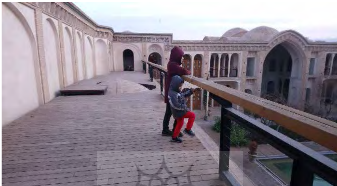
تصویر ۱۸. کف موقت بر روی پشت بام جبهه پنچ دری حیاط اندرونی خاتۀ عامری‌ها. زده حفاظتی امنیت کودکان را موقع استفاده تأمین می‌کند. عکس: الهام اندرودی، ۱۳۹۸.