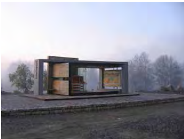
تصویر ۵. کیوسک اطلاع‌رسانی بیستون.