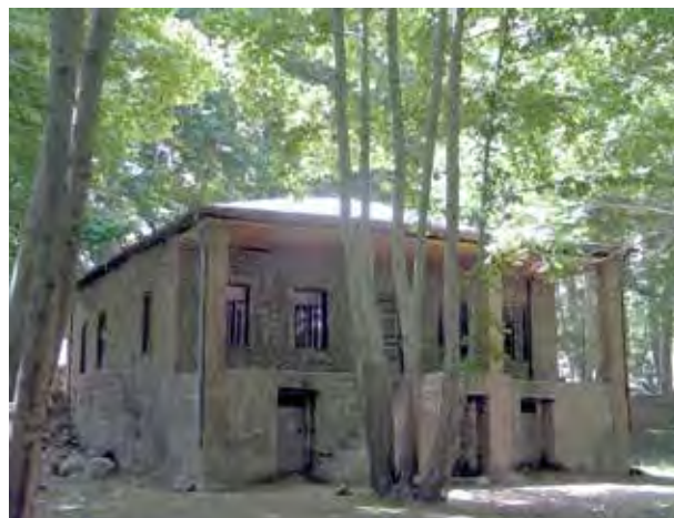
تصویر ۴. خانه پژوهشگران. عکس: مونا ابراهیمی، ۱۳۸۸.

کنار ورودی خانه عامری‌های کاشان (تصویر ۹). کودکان نیازمند فضاهای بازی هستند که می‌تواند پشت بام جذاب یک حمام تاریخی باشد همانند خانه عامری‌های کاشان.