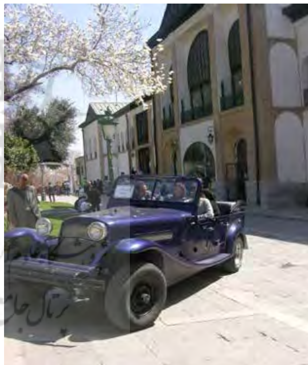
تصویر ۷. نمایشگاه اتومبیل‌های قدیمی در کاخ نیاوران.

- تجهیزات مدیریت صف، پلکان موقت، دست‌انداز گاردریل حفظ ایمنی گردشگر و استفاده از مصالح با دوام ضروری است. استفاده از داربست برای پاسخ به کلیه این نیازها مناسب نیست؛ همانند قلعه الموت (تصویر ۱۴). - آبخوری، نیمکت، صندلی، سطل زباله، گلجای این مبلمان اغلب توسط بهره‌برداران به شکل آماده از بازار تهیه می‌شوند. عدم وجود طرح‌های مناسب با بستر تاریخی از کمبودهای مبلمان موجود در بازار