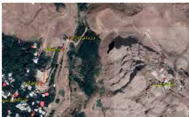
تصویر ۱. تجزیه و تحلیل موقعیت زیرساخت‌ها در چهار محوطه میراث در ایران: تخت جمشید (بالا، چپ)، بیستون (بالا، راست)، پاسارگاد (پایین، سمت چپ)، قلعه الموت (پایین، سمت راست)