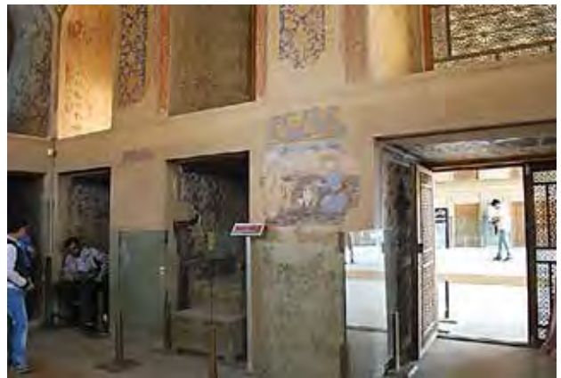
تصویر ۱۵. صفحات شیشه‌ای محافظ دیواره‌های نقاشی‌شده کاخ چهلستون؛ عکس: مرضیه ابراهیمیان، ۱۳۸۹.

تأسیسات گرمایش و سرمایش تأسیسات و تجهیزات همانند کولر و کانال کولر، اسپلیت یونیت، لوله‌کشی و سیم‌کشی و الحاقات مورد نیاز لازمه طراحی و نگهداری در درازمدت هستند و به خواست مدیر محوطه به حفظ اصالت و یکپارچگی بصری و نظارت دراز مدت بستگی دارند. این بند در اغلب محوطه‌های برداشت شده نیازمند بازنگری است.