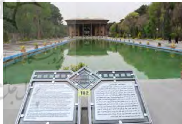
تصویر ۱۳. تابلوهای راهنمای محوطه کاخ چهلستون. عکس: مرضیه ابراهیمیان، ۱۳۸۹.

ضروری است. همانند حفاظ شیشه‌ای چهلستون و نقش‌برجسته‌های تخت جمشید (تصاویر ۱۵ و ۱۶). در ایام اوج گردشگری دسترسی به بخش‌های مهم می‌تواند محدود شود؛ همانند حصارکشی به دور دروازه ملل تخت جمشید در ایام نوروز و عدم اجازه گذر از میان دروازه به دلیل احتمال ازدحام و فشار جمعیت. • نورپردازی داخلی و خارجی