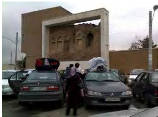
تصویر ۲۰. پارکینگ در خیابان همجوار خانه عامری‌ها. عکس: مونا ابراهیمی، ۱۳۹۶.

اما در طول یک دهه انجام پیمایش در این پژوهش از ۱۳۸۸ تا ۱۳۹۸، میلان و عناصر معماری رشد چشمگیری در کیفیت مصالح و نوع طراحی کرده‌اند و طراحان با بهره‌گیری از متغیرهای مناسب‌تر موجود در بازار در کف‌سازی و نورپردازی، راه‌حل‌های بهتری را ارایه کرده. همچنین رشد جریان بهره‌برداری از بناهای واجد شرایط در محوطه برای کاربری‌های جدید همانند هتل به رونق گردشگری فرهنگی کمک شایانی کرده است. همچنین حساسیت‌های مدیریت و نگهداری از محوطه‌ها نسبت به طراحی عناصر و جزییات نیز افزایش چشمگیری داشته است. در نهایت یافته‌های پژوهش نشان می‌دهد که مدیریت خدمات در محوطه‌ها نیازمند اولویت‌دادن به حفاظت بر درآمد است و مدیریت محوطه میراث نقش کلیدی در برقراری توازن میان نیازهای اقتصادی، طرح معمارانه، زیرساخت‌های گردشگری مورد نیاز، تعمیر و نگهداری در درازمدت و حفاظت از بنا دارد.