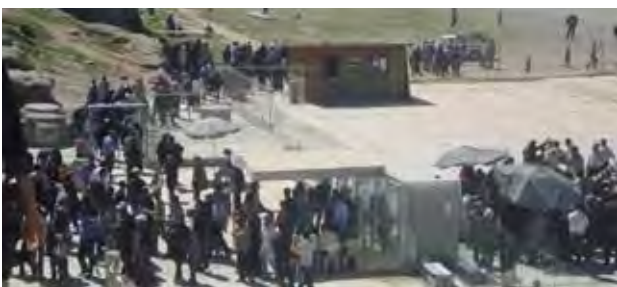
تصویر ۱۰. ورودی تخت جمشید. عکس: پریسا گنج‌آبادی، ۱۳۹۰.