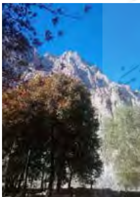
تصویر ۹. منظر طبیعی اطراف محوطه میراث جهانی بیستون و درختان چنار کهنسال. عکس: الهام اندرودی، ۱۳۹۸.