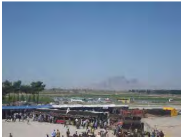
تصویر ۶. نمایشگاه موقت در سیاه‌چادر عشایر. عکس: پریسا گنج‌آبادی، ۱۳۹۰.