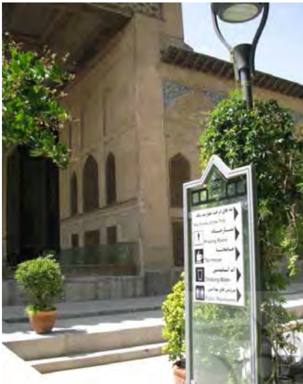
تصویر ۱۲. تابلوهای راهنمای محوطه کاخ چهلستون. عکس: مرضیه ابراهیمیان، ۱۳۸۹.