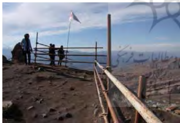
تصویر ۱۴. دست‌انداز با داربست در قلعه الموت.