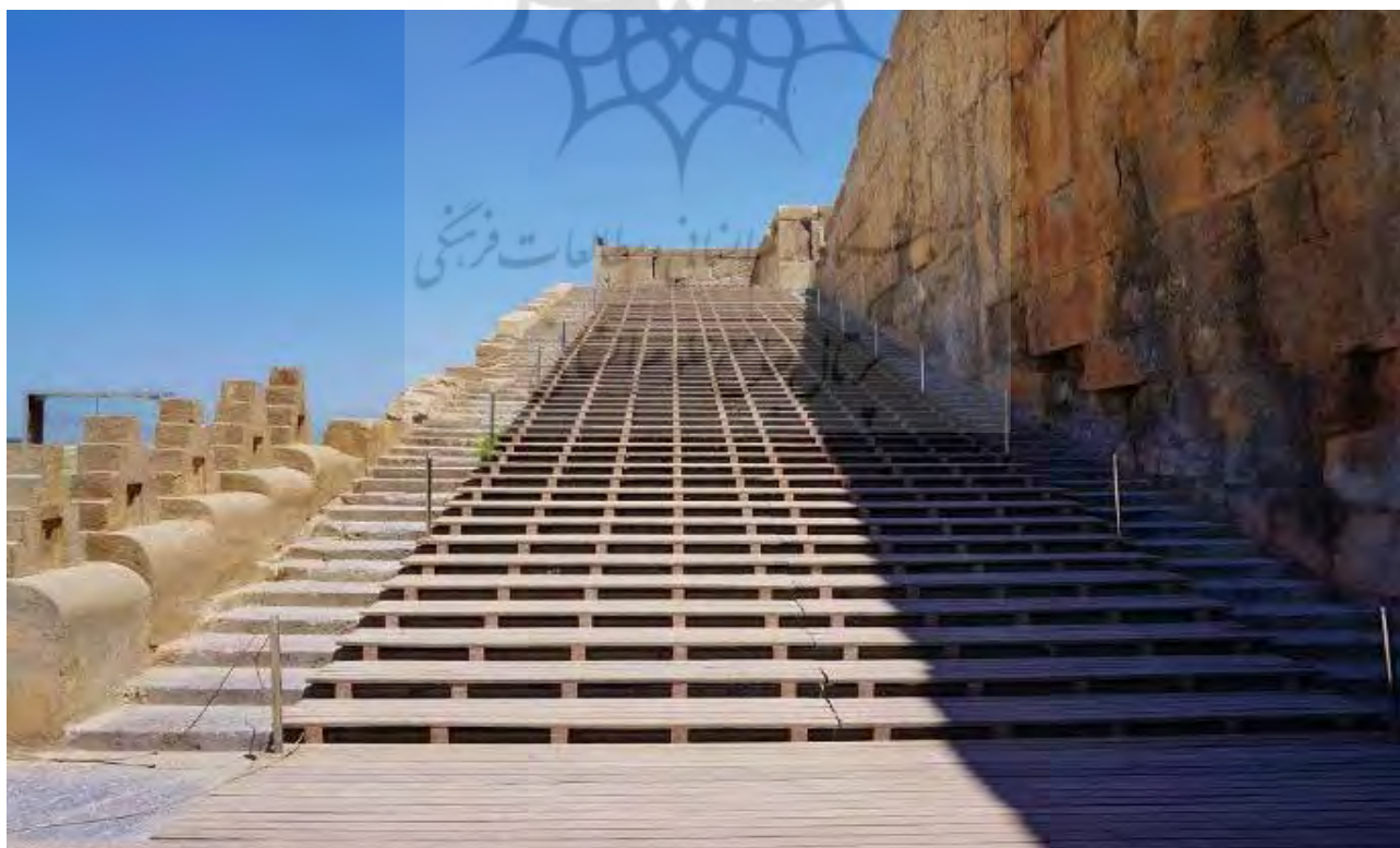
تصویر ۱۹. کف موقت پلکان تخت جمشید جلو فرسودگی پلکان اصلی را می‌گیرد.