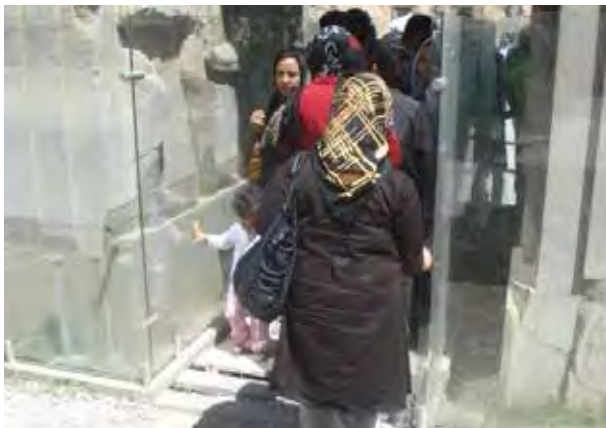
تصویر ۱۶. صفحات شیشه‌ای محافظ نقش برجسته‌های تخت جمشید. عکس: پریسا گنج آبادی، ۱۳۹۰.