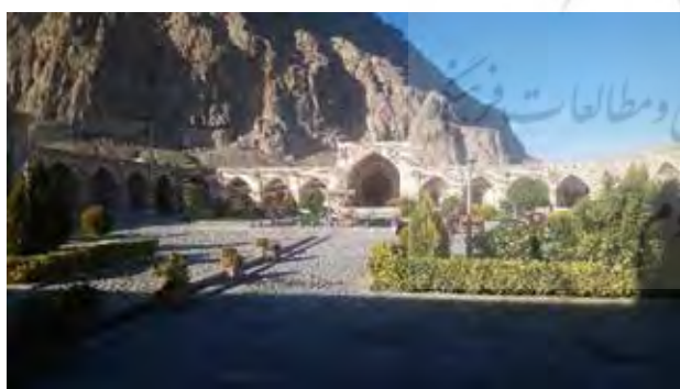
تصویر ۳. کاروانسرای بیستون که به هتل تبدیل شده است.