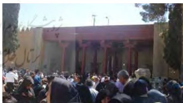
تصویر ۲. موزه تخت جمشید در ایام نوروز. عکس: پرسا گنج آبادی، ۱۳۹۰.

در صورتی که این فضاها با نظارت مدیران محوطه ایجاد نشوند و به بهره‌برداران سپرده شوند، ممکن است فضایی التقاطی و ناهمخوان با بافت اطراف را پدید می‌آورند. فروشگاه‌های صنایع دستی عامل تقویت‌کننده محصولات محلی و کارآفرینی اهالی بومی هستند و حضورشان باعث تنوع عملکرد در محوطه میراث است (همانند فروشگاه‌های