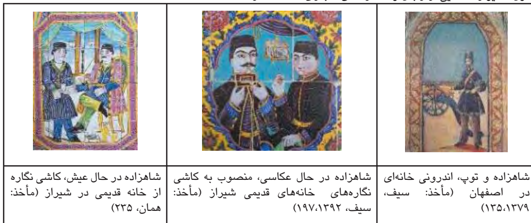
جدول ۱. دیوارنگاه‌هایی از رجال و شاهزادگان قاجاری

علمای مذهبی، زمین‌داران و تجار بود. و دهقانان و پیشه‌وران و کارگران در قعر این هرم جای داشتند. در زمان قاجاریان، مطمئن‌ترین دستمایه سرمایه‌داران زمین‌داری بود، و ایشان اکثر نقدینگی خود را به زمین تبدیل می‌کردند. این امر سبب تحولاتی پیرامون مسئله مالکیت زمین در کشور شد. در این راستا پاولوویچ، اشاره دارد که: «مالکیت زمین به‌طور فزاینده‌ای از دست دربار و صاحبان قدرت به دست بازرگانان، علما و صاحب‌منصبان منتقل شد» (۶۱۸، (Pavlovitch, 1910). این روال سبب به وجود آمدن نظامی شبه بورژوازی شد. (Keddie, 1971, 5) عنصر اصلی دیگر در طبقه ملاکین، تجار شهری بودند که بر تولیدات کشاورزان سرمایه‌گذاری می‌کردند و محصول را با اقل قیمت خریداری می‌کردند و در اختیار اروپاییان و عمدتاً روس‌ها می‌گذاشتند و در عوض سود قابل ملاحظه‌ای دریافت می‌کردند. از این روی ملاکین جدید، از جمله تاجران، اربابان و سران قبایل به قدرت سیاسی و اقتصادی متناسبی دست‌یافته بودند. همان‌طور که لامبرت می‌گوید: «در طول دوره قاجار، طبقه ملاک [...] از قدرتمندترین رجال نظام پادشاهی بودند» (Foran, 1989, 29).