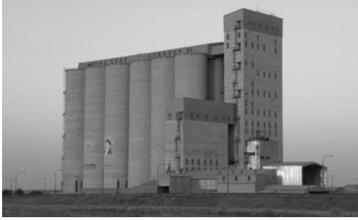
تصویر ۴: سیلوی ذخیره غلات؛ نمونه‌ای از مجموعه‌های صنعتی با علت غایی رسیدن به فضایی برای ارائه خدمات؛ مأخذ: نگارنده