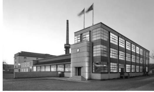
تصویر ۳: کارخانه کفش‌سازی فاگوس؛ نمونه‌ای از مجموعه‌های صنعتی با علت غایی رسیدن به فضایی برای تولید کالا؛ مأخذ: https://en.wikipedia.org