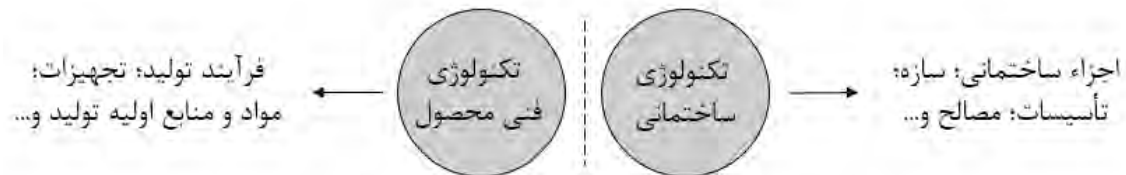
تصویر ۶: مشخصه‌های علت مادی در معماری مجموعه‌های صنعتی؛ مأخذ: نگارنده

براساس دیدگاه ارسطو، علت مادی، ماده‌ای است که از آن به صورت می‌رسیم. تکنولوژی‌های فنی مرتبط با تولید محصول بخشی از این علت است که موجودیت یافتن معماری در مجموعه‌های صنعتی در گرو آن است. این تکنولوژی همان تجهیزات و ارتباطی است که میان آنها برقرار است و به واسطه خط تولید در یک مجموعه صنعتی به کار گرفته می‌شود. به عبارت دیگر، معماری در این مراکز وابسته به فرآیندی است که برون‌داد آن محصول یا خدمات است. اما این فرآیند با تجهیزات، وجه عینی خود را می‌یابد و مواد یا ماده معماری را فراهم می‌آورد. مواد و منابع اولیه تولید هم بخش دیگری از همین تکنولوژی است که باید به کار گرفته شود تا معماری صنعتی صورت لازم را کسب نماید. از سوی دیگر، این تجهیزات به کالبدی مادی نیازمند است تا فضای مورد نیاز را تأمین نماید. پس کالبد و اجزای آن بخش دیگری از علت مادی معماری مجموعه‌های صنعتی است. این کالبد به نوبه خود وابسته به اجزاء ساختمانی، سازه، تأسیسات و مصالح است. همه اینها جمعاً، ماده یا پتانسیلی است که می‌تواند به صورت برسد (تصویر ۶).