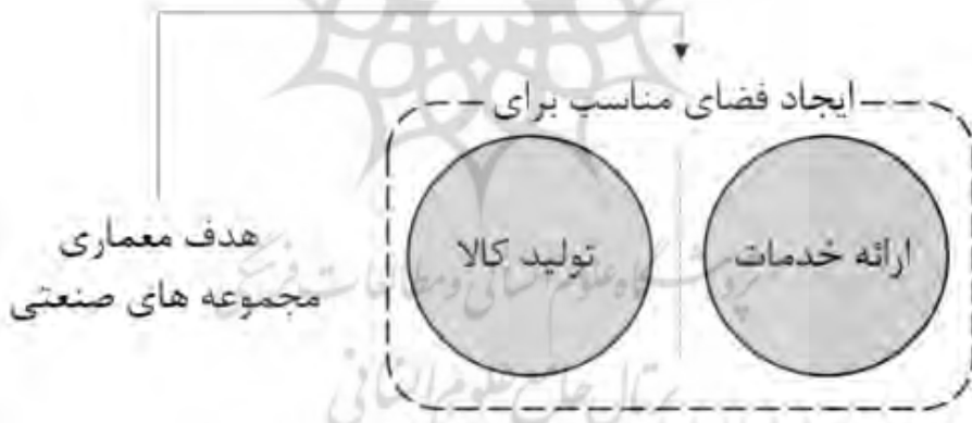
تصویر ۲: مشخصه‌های علت غایی در معماری مجموعه‌های صنعتی؛ مأخذ: نگارنده

علت غایی معماری مجموعه‌های صنعتی را باید به صنعت نسبت داد. صنعت هم‌خانواده تصنع، صنعت و مصنوع بوده و در فرهنگ‌لغات فارسی ۱ بر هنر، پیشه و ساخت دلالت دارد. این واژه به عملکرد هر یک از مراکز یا رشته‌های تولیدی اعم از کارخانه‌ها و کارگاه‌ها نیز اطلاق می‌شود. صنعت در فرهنگ‌لغات انگلیسی ۲ عمدتاً به ساخت محصولات جدید با استفاده از ماشین در کارخانه‌ها یا محل‌های مشخص اشاره دارد. صنعت در زبان عربی و به‌ویژه در قرآن معادل فن ساختن (زره) ۳ به‌کار رفته است. هم‌چنین، هم‌خانواده‌های آن در جایگاه آفرینش خداوندی ۴ ، ساخت کشتی ۵ ، ساخته‌های ساحران ۶ و افعال آدمی ۷ آمده است. مقایسه معانی فوق مؤید آن است که صنعت از گذشته تا اکنون، از پیشه تا تولید مدرن، از کارگاه تا کارخانه و از تولید دستی تا تولید ماشینی را دربرمی‌گیرد. فارغ از تفاوت‌های معنوی و شیوه‌ای حاضر در معنای سنتی و امروزی صنعت، تعریف این مفهوم وابسته به تعریف تولید است. تولید در لغت ۸ به پرورش دادن، ایجاد کردن، استخراج، خلق کردن و... اشاره دارد. این مفهوم بر جریانی دلالت دارد که درون‌داده‌ها را از طریق فرآیندهای تولیدی به برون‌داده‌ها یعنی کالاها و خدمات تبدیل می‌کند (لیندبک، ۱۳۷۶: ۵؛ Kumar & Suresh, 2009: 3). بنابراین مجموعه‌های صنعتی بر مراکزی دلالت دارد که برخوردار از چنین کارکردی باشد. پس، معماری در مجموعه‌های صنعتی سعی در فراهم آوردن فضای مناسب برای فرآیندهای تولیدی است که برون‌دادهای آن، به دو شکل خدمات و کالا متجلی می‌شود. لذا علت غایی این معماری رسیدن به فضایی برای ارائه خدمات و یا تولید کالا است (تصاویر ۲-۴).