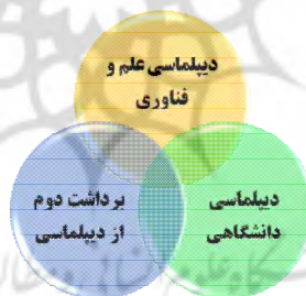
شکل ۱: مدل مفهومی ادبیات پژوهش

مطالعات نشان می‌دهند که مفاهیم، رویکردها، مدلها و مباحث نظری و تکنیکی مربوط به حوزهٔ تعاملات بین‌المللی دانشگاهی در سه عرصهٔ علمی شکل می‌گیرند که عبارتند از: «دیپلماسی علم و فناوری یا دیپلماسی علمی»، «دیپلماسی دانشگاهی» و نیز «برداشت دوم از دیپلماسی». به طور کلی، مدل مفهومی ادبیات پژوهش، پیرامون موضوع «تعاملات بین‌المللی دانشگاهی» مطابق شکل ۱ است.