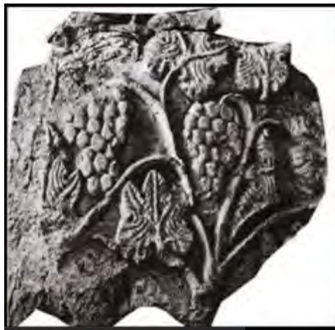
تصویر ۳: تپه‌میل، قطعه گچ‌بری با نقش انگور (مأخذ: چهری، ۱۳۸۶: ۳۱۲)