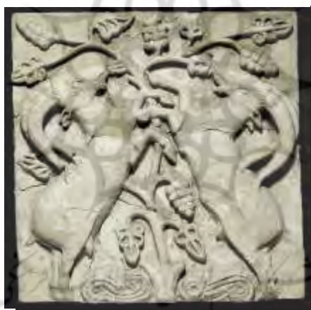
تصویر ۲: شوش، درخت زندگی

درخت انگور به‌منزله نمادی از خیر و برکت یکی از نقوش بسیار مهم دوره ساسانی است که تکرار آن در شوش، تپه‌میل و بیشاپور خود بر این اهمیت آن صحنه می‌گذارد و نشان می‌دهد، این نماد با توجه به مفهوم اعتقادی و مذهبی آن - که نمادی از برکت است - در صحنه معروف زندگی (شوش) با عنوان درخت زندگی آمده است. از دلایل به‌وجود آمدن نگاره درخت زندگی را می‌توان وجود حس فطری جاودانگی در ذات بشریت دانست که همواره در اندیشه یافتن راهی برای جاودانگی خویش بوده است. درخت شاید بدین دلیل به‌منزله نماد زندگی انتخاب شده که در طول تاریخ فواید و تأثیرات مهمی در زندگی بشر داشته و مورد توجه و احترام خاص انسان بوده است و از جهتی دیگر به‌دلیل طول عمر زیاد بسیاری از درختان و باروری و خیر برکت آن‌ها، درخت را به‌منزله نمادی از جاودانگی پذیرفته‌اند. درخت مقدس از جمله نقوشی است که تأکیدات مذهبی فراوانی پیرامون آن شده و حضور پررنگ این نقش در آثار هنری دوره ساسانی نشان از جایگاه مهم این نقش‌مایه دارد.