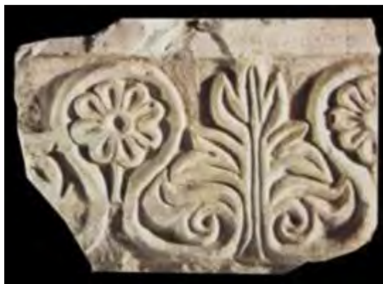
تصویر ۸: خارک، قطعه گچ‌بری برگ خرما