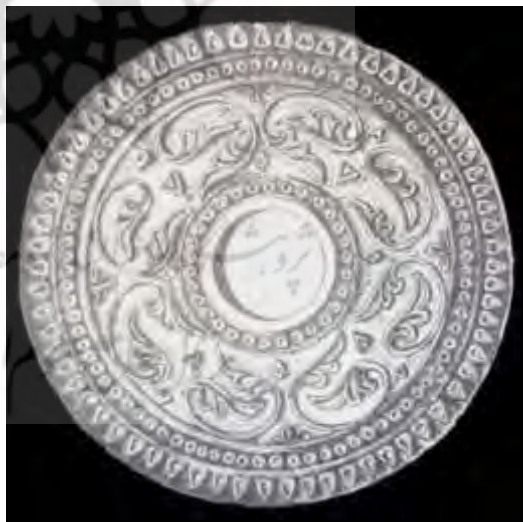
تصویر ۵: بیشاپور، لوح گچ‌بری برگ خرما