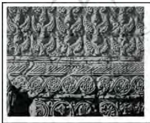
تصویر ۹: چال ترخان، لوح گچی با نقش انار

انار دارای مفهومی جهانی است و همواره در بین ملل مختلف دارای اهمیتی خاص بوده است و بیشتر آن را نماد و نشانه‌ای از باروری دانسته‌اند و این گسترده بودن مفهوم انار سبب اشتراکات مفهومی و نمادی این میوه در بین ملل مختلف شده است. برای مثال، در یونان نمادی از آفرودیت و در ایران نمادی از آناهیتا است که هر دوی این الهگان نشان باروری و خیروبرکت هستند. از انار در اوستا نامی به میان نیامده و در متون پهلوی از جمله بندهش آن را میوه‌ای بهشتی دانسته‌اند. در پایان، گفتنی است، اهمیت انار به حدی است که در دوره اسلامی نیز جایگاه خود را از دست نداده و در «قرآن مجید (الرحمن/ آیه ۸) از انار به منزله میوه‌ای بهشتی یاد شده است.