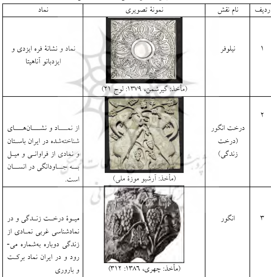
جدول ۱: نقوش نمادین گیاهی در دوره ساسانی

آناهیتا به‌منزله ایزد باروری بوده است. کلیت این نمادهای مورد بررسی، نشان می‌دهد، همه در چارچوب اعتقادات مذهبی و جهان‌بینی مذهبی ساسانیان قرار داشته‌اند و هدف از خلق آثار هنری نمادین و اساطیری در این دوره نشان دادن مذهب به‌منزله جزئی جدایی‌ناپذیر از حکومت سیاسی بوده است و همان‌طور که در نقش برجسته‌ها، سکه‌ها و ظروف نقره‌ای شاهان ساسانی همواره در مشروعیت‌بخشی کوشش می‌کردند، در خلق این نمادها نیز با بهره‌گیری از این عناصر در تلاش برای انعکاس اندیشه دینی خود و نشان دادن خط فکری مذهبی خود برای مشروعیت‌بخشی خود بوده‌اند.