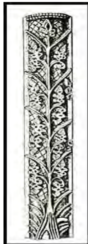
تصویر ۴: بیشاپور، قطعه گچ‌بری با نقش انگور (مأخذ: گیرشمن، ۱۳۷۹: لوح ۴۹)