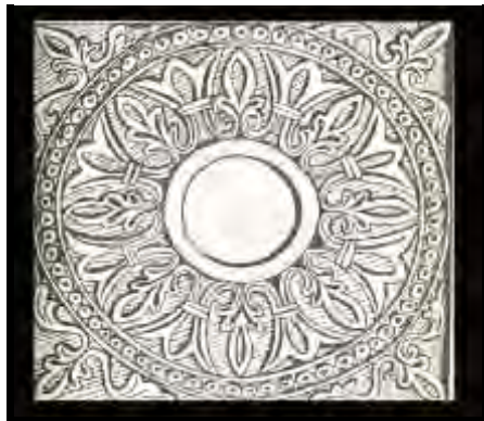
تصویر ۱: بیشاپور، قاب گچی با نقش نیلوفر