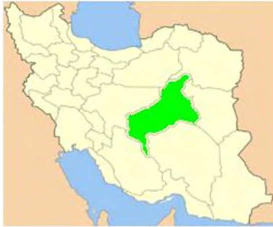
شکل ۱. موقعیت استان یزد