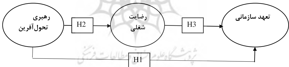
شکل ۱: مدل مفهومی پژوهش (برگرفته از آلن و مایر (۱۹۹۶)، باس و اویلیو (۲۰۰۰) و مینه سوتا (۱۹۹۹))

در نهایت مدل مفهومی پژوهش در شکل ۱ آورده شده است: