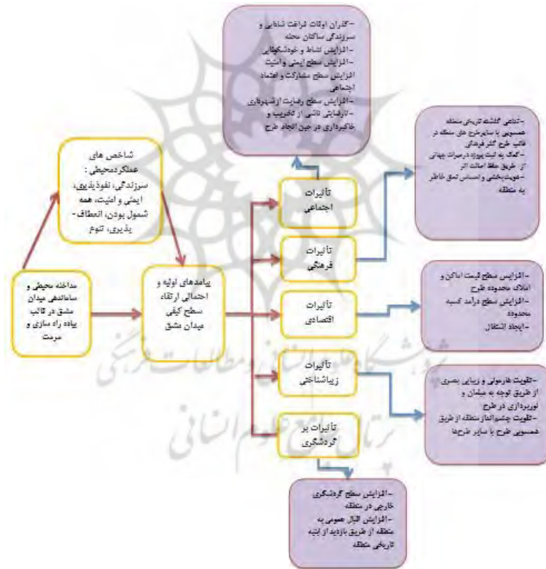
تصویر شماره ۱: مدل نظری و مفهومی تأثیرات احتمالی طرح