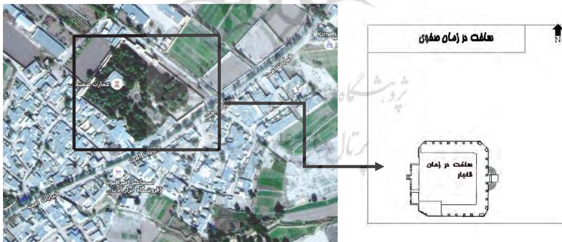
تصویر ۱. موقعیت قرار گیری عمارت صمیمی

عمارت صمیمی یا باغ امیر سپهدار از بناهای سکونتی - حکومتی دوره قاجار است و به عنوان حاکم نشین شهرستان رامهرمز استفاده می‌شد. این عمارت متأثر از باغ‌های فرنگی ساخته شده است. عمارت از دو بخش ساختمانی تشکیل شده است. احداث ساختمان مرکزی به حدود ۱۱۰ سال قبل باز می‌گردد و متعلق به عصر قاجار می‌باشد و قدمت ساختمانی شمالی باغ که با توجه به سبک و اسلوب معماری صفوی است به بیش از ۴۰۰ سال می‌رسد. این عمارت در محله قدیمی کیمه و در نزدیکی دیگر بنای تاریخی شهر به نام قلعه امیر مجاهد، قرار دارد. ورودی اصلی عمارت که در قدیم مورد استفاده بود، در بنای شمالی عمارت و مربوط به دوره صفوی بود. این درب در خیابانی اختصاصی در شمال