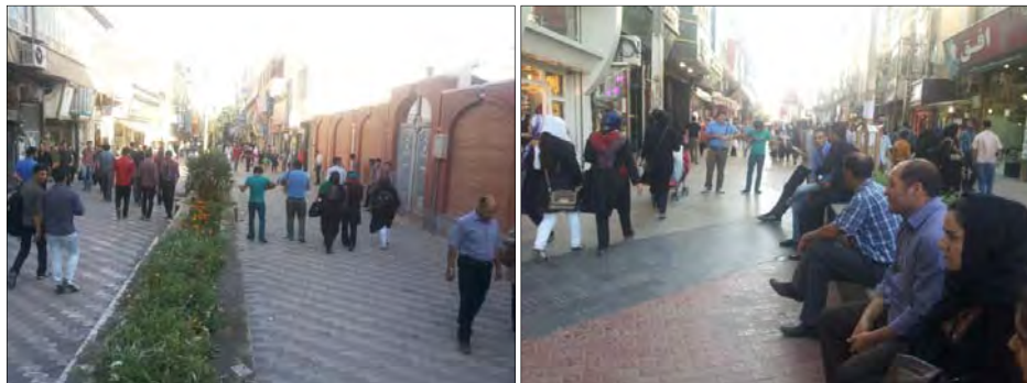
تصویر ۳ و ۴. اجرای موسیقی خیابانی در پیاده راه خیام

در جدول ۵، R معادل ضریب همبستگی است و R square معادل مجذور ضریب همبستگی بوده ضریب تعیین نام دارد. Adjusted R square ضریب تعیینی است که