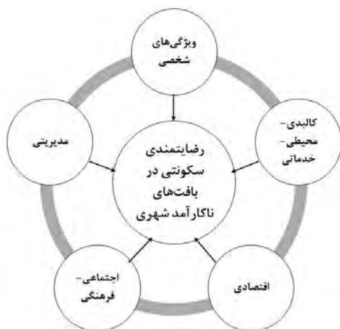
شکل ۱. ابعاد تأثیرگذار بر رضایتمندی سکونتی در بافت‌های ناکارآمد شهری