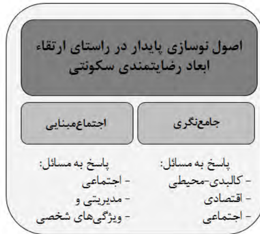
شکل ۲. اصول نوسازی بافت‌های ناکارآمد شهری با هدف ارتقاء رضایتمندی سکونتی، منبع: نگارندگان با اقتباس از LUDA, 2004 و Roberts & Sykes, 2000

در بعد کالبدی- محیطی نوسازی با هدف بهبود فیزیکی محیط ساخته شده و ایجاد تعادل میان توسعه‌های جدید و قدیم (Lee Grace, 2008: 42) بر آن است به جستجوی محدودیت‌ها و توان‌های بالقوه کالبدی می‌پردازد تا کالبد شهر را با دگرگونی‌های سریع اقتصادی و اجتماعی هماهنگ کند (Roberts & Sykes, 2000: 77 و Ng, Cook, & Chui, 2001: 178). از پتانسیل‌های کالبدی موجود دست کم می‌توان به تمام جنبه‌های سرمایه همچون ساختمان‌ها، زمین و محوطه‌ها، فضاها، فضاهای شهری، فضای باز و آب، تأسیسات و