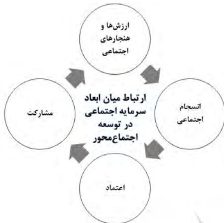
شکل ۳: ارتباط ابعاد مختلف سرمایه اجتماعی در توسعه اجتماع محور

میان مسئولان محلی نوسازی با ساکنان ارتقاء یافته و به موجب آن مشارکت فعال ساکنان را در این امر می‌توان انتظار داشت. و به همین ترتیب ارزش‌های جدید در جامعه شکل خواهد گرفت و فرآیند نوسازی مبتنی بر سرمایه‌های اجتماعی تحقق خواهد یافت (شکل ۳).